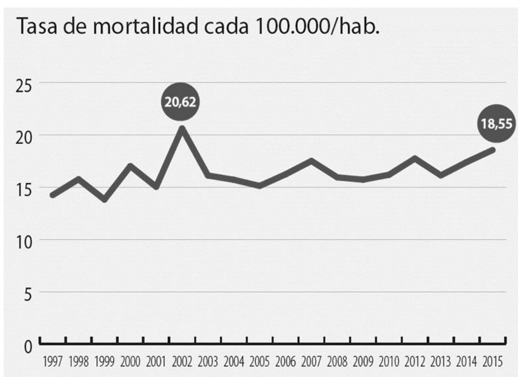
Figura 1. Evolución de la tasa de mortalidad por suicidio en Uruguay.