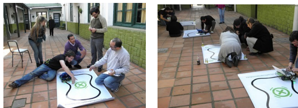
Figura. 5: Talleres de programación de robots.

Asimismo, a cada participante se le propuso la realización de un trabajo individual, con los objetivos de brindar la oportunidad a cada docente de manipular, armar 3 y programar un robot para la