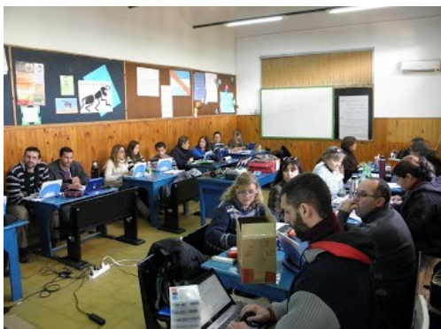
Figura. 2: Talleres de programación.

programación (ver fig. 2), interacción con sensores (ver fig. 3), control de motores, armado de un robot (ver fig. 4) y finalmente, programación del robot para la resolución de un problema simple (ver fig. 5).