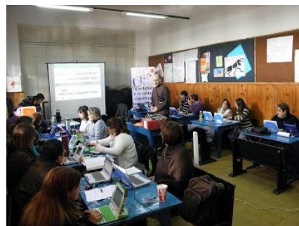
Figura. 1: Presentación teórica.

Durante las mismas, se implementaron exposiciones teóricas (ver fig. 1 ) que incluyeron una agenda temática variada: introducción a la Robótica Pedagógica, introducción a la Inteligencia Artificial y Robótica, presentación del Proyecto Butiá y Programación de robots.