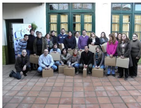
Figura. 6: Cierre de la actividad presencial.

Luego, los kits robóticos construidos fueron entregados a cada participante, en carácter de préstamo, para su utilización en el centro de estudios con sus alumnos (ver fig. 6).