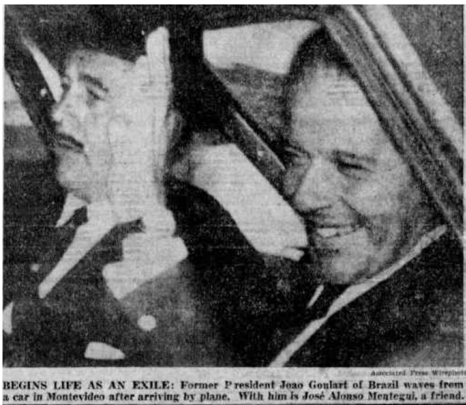
Foto 3: Llegada de João Goulart a Uruguay junto a José Alonso Montegui. 234