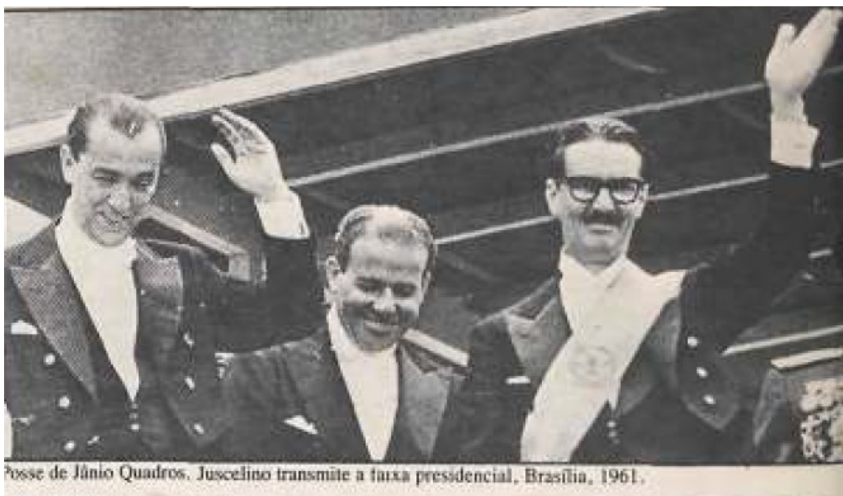
Foto 1: Asunción del presidente Jânio Quadros, entrega la faja presidencial Juscelino Kubitschek, João Goulart asume como vicepresidente, 1961. 232