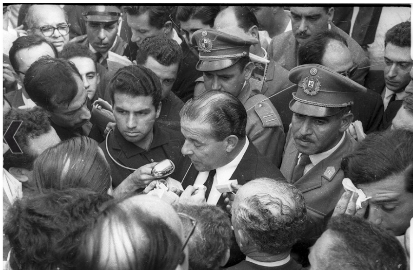
Foto 4: Conferencia de prensa de João Goulart, exiliado en Uruguay luego del golpe de Estado en Brasil. Balneario de Solymar. 235