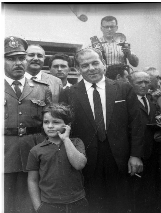
Foto 5: João Goulart y su hijo João Vicente, exiliados en Uruguay luego del golpe de Estado en Brasil. Al momento de la conferencia de prensa brindada en el Balneario de Solymar. 236