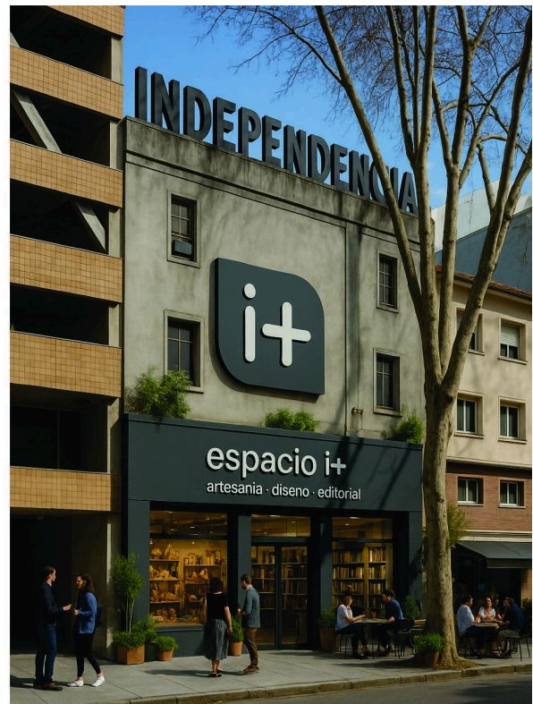
Fig.3 Ex Cine Independencia abandonado (Izq) ubicado en Florida y Soriano. Inteligencia Artificial (Der.)