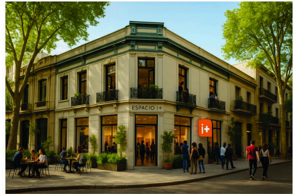
Fig.2 Inmueble abandonado (Izq) ubicado en Convención y Canelones. Inteligencia Artificial (Der.)