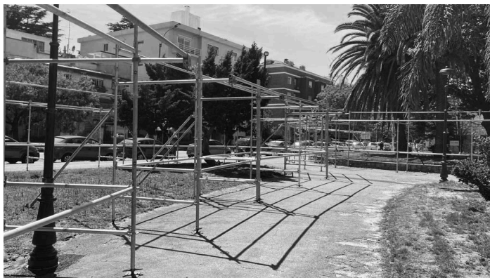
Fig.1 El día después de finalizada la feria.

Más allá de su dimensión comercial, las ferias tienen un valor simbólico y social que las convierten en espacios clave para la vida cultural de las comunidades. En este sentido, es importante destacar que “las ferias han sido, y siguen siendo, espacios de encuentro y de conflicto para sujetos sociales diversos, así como plataformas de difusión de prácticas y objetos culturales” (Montenegro, 2012, p. 172). Esta perspectiva refuerza la idea de que no se trata solo de instancias de comercialización, sino de experiencias culturales complejas y significativas, que merecen sostenerse en el tiempo.