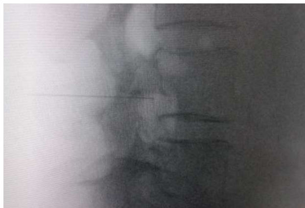
Fig. 1. Vista radiológica de perfil que muestra una cánula de radiofrecuencia en el ángulo anterosuperior o techo del neuroforamen, topografía aproximada del ganglio de la raíz dorsal.

El acceso por vía transforaminal es el más utilizado [4]. Se coloca al paciente en decúbito prono con una almohada a nivel abdominal para revertir la lordosis fisiológica. Las agujas o cánulas de radiofrecuencia que utilizamos con más frecuencia son de diámetro 20 o 22 G de 98 mm de largo con punta activa de 0,5 o 1 cm. Después de la asepsia con clorhexidina alcohólica y la colocación de campos estériles, se realizan enfoques radiológicos en incidencia anteroposterior, oblicuo y lateral. En incidencia anteroposterior y moviendo el arco en dirección cráneo caudal se borra el doble arco del borde inferior vertebral. En incidencia oblicua entre 20 y 30 grados ipsilateral al GRD a tratar, se visualizará la clásica imagen descrita como de "Scotty Dog", que es resultado de acercar el macizo facetario y la apófisis espinosa al lado contralateral. El punto de entrada será entonces inmediatamente debajo del pedículo. Previa anestesia local con lidocaína al 1 %, la aguja se introducirá siguiendo una visión túnel y no se avanzará más allá de la mitad del pedículo en esta proyección con la finalidad de prevenir la lesión neural. En proyección lateral, se introducirá en el techo del neuroforamen