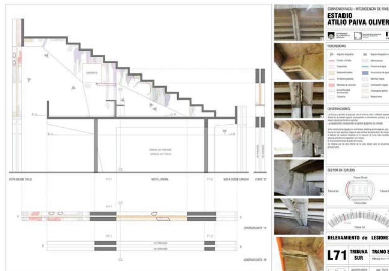
Figura 3. Mapeo de lesiones del tramo 01 de tribuna Sur. Pórtico P111-P112.

Todas ellas fueron graficadas en plantas, fachadas y cortes de gradas, losas y pórticos. Los mapeos resultaron de gran utilidad a los efectos de analizar las más recurrentes, las ubicaciones características y constatar situaciones atípicas. Como es sabido, estos gráficos acompañados de imágenes debidamente referenciadas constituyen un registro actualizado del estado de situación y resultan necesarios para la determinación de causas, así como también para monitorear la evolución en el tiempo de las lesiones o para evaluar futuras reparaciones (Figura 3).