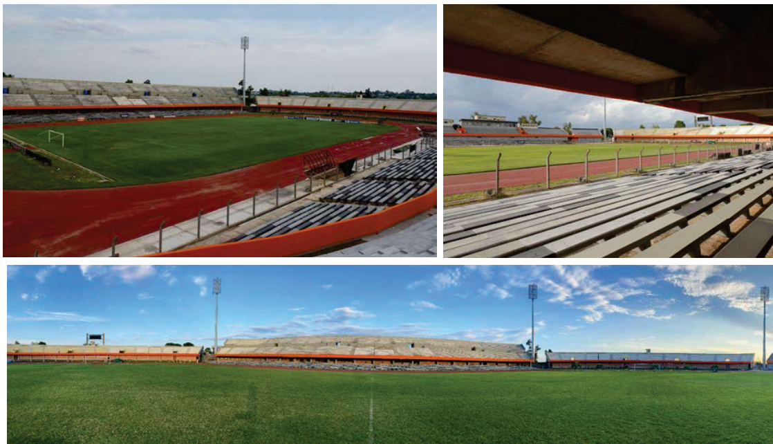
Figura 1. Tribunas Norte, Italia y Sur (de izquierda a derecha).

La solicitud de la Intendencia de Rivera a la FADU surge a partir de la preocupación ante la constatación de lesiones, especialmente en los elementos de hormigón armado que conforman la estructura de las cuatro tribunas. La situación es entendible si se tiene en cuenta el escaso mantenimiento registrado desde la última ampliación.