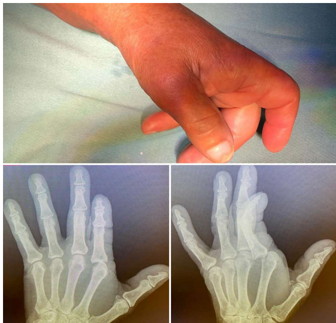
Figura 1. Apresentação clínica na emergência. A) Apresentação clínica na emergência: articulação metacarpofalangeana (MCF) hiperestendida a 30° e interfalangeana levemente fletida. B e C) Radiografias simples: incidência anteroposterior mostrando o deslocamento ulnar da falange proximal e o alargamento do espaço articular. A radiografia oblíqua confirma o deslocamento dorsal da falange proximal.

A hiperextensão energética determinou uma luxação dorsal complexa da articulação metacarpofalangeana do segundo dedo da mão esquerda, apresentando-se na emergência com atitude patológica, com a articulação MCF em 30° de extensão e as articulações interfalangeanas levemente fletidas, com impossibilidade de mobilização articular do segundo raio (Figura 1).