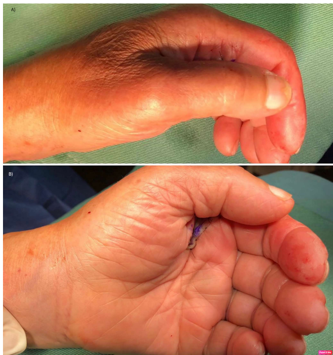
Figura 3. Pós-operatório imediato. Apresentação clínica em frente e perfil. Vê-se a correção da atitude patológica típica dessas lesões.