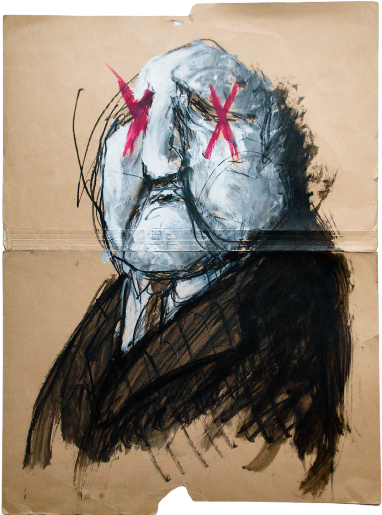
Rumiante-030 de la serie Rumiantes de Sebastián Santana Camargo, Uruguay.