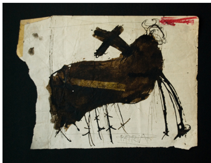
Rumiante-cero-0051 de la serie Rumiantes de Sebastián Santana Camargo, Uruguay.

Que sobre una misma marca, cruces rojas como X puestas en una línea también roja, hay una serie empezada hace más de veinte años que cada tanto vuelve en forma de imágenes, de una insistencia, de la certeza de que nada ha cambiado tanto en un quinto de siglo. Pero bueno, a fin de cuentas nada cambió demasiado, tampoco, durante los últimos dos siglos en esta tierra de pastoreo, entrada de comercio, salida de buques, casa de paso, hogar de expectantes, sitio de rumiantes.