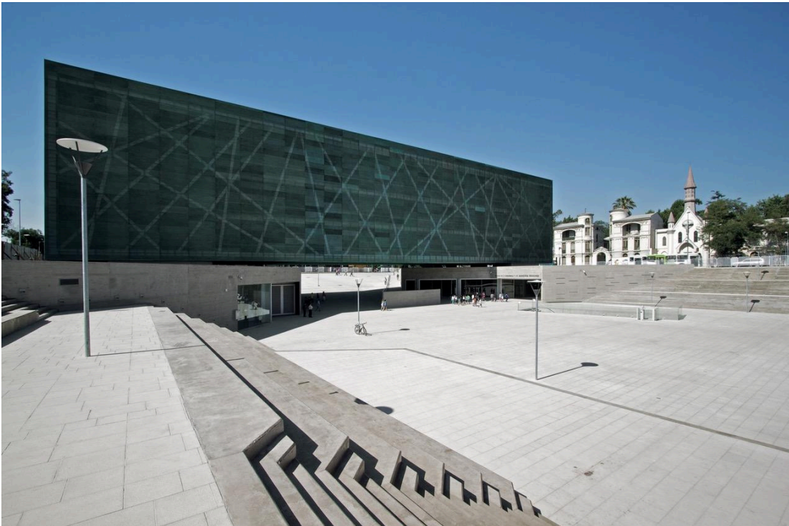
Fotografía Museo de la Memoria y los Derechos Humanos. Extraído de Centro Internacional para la Promoción de los Derechos Humanos