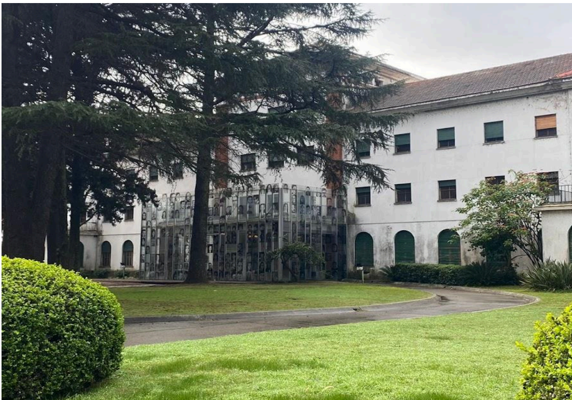
Fotografía Museo Sitio de Memoria ESMA, elaboración propia.