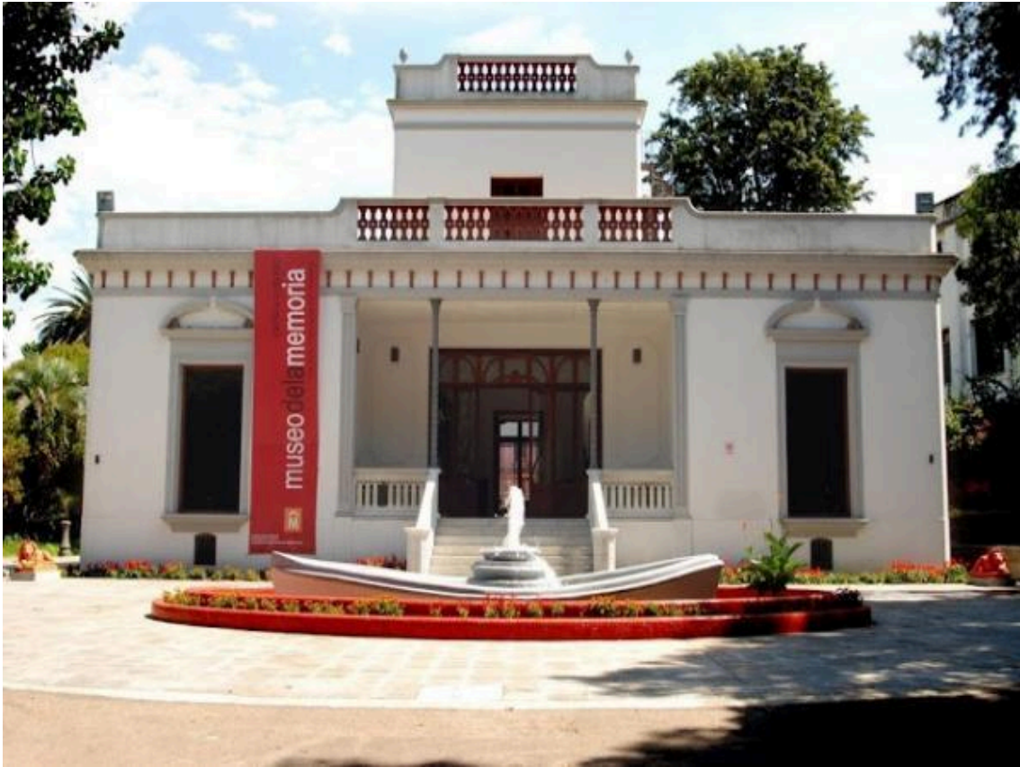
Fotografía Museo de la Memoria. Extraído de la web oficial. https://mume.montevideo.gub.uy/