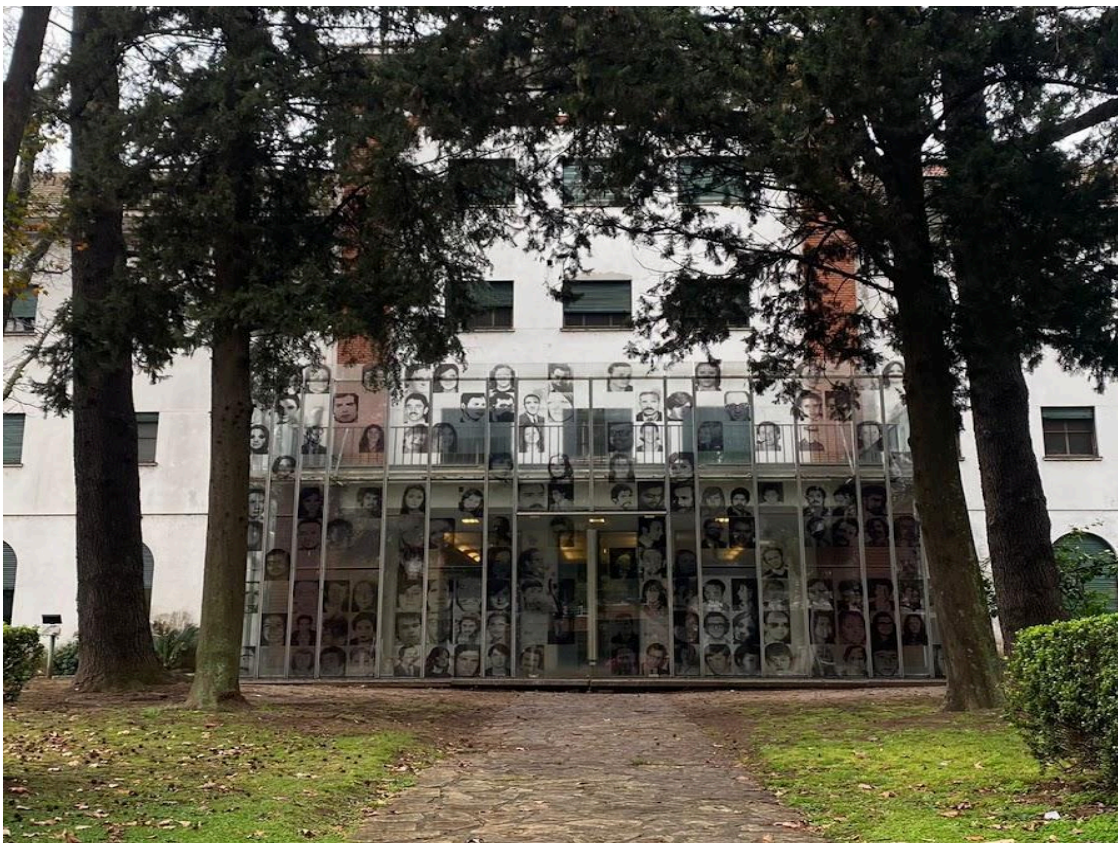
Fotografía Museo Sitio de Memoria ESMA. Elaboración propia.