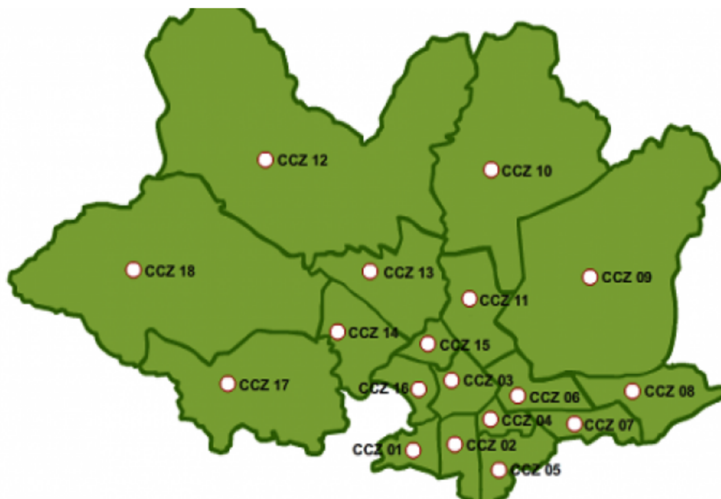
Ilustración 1. Mapa de centros comunales zonales (CCZ) en Montevideo