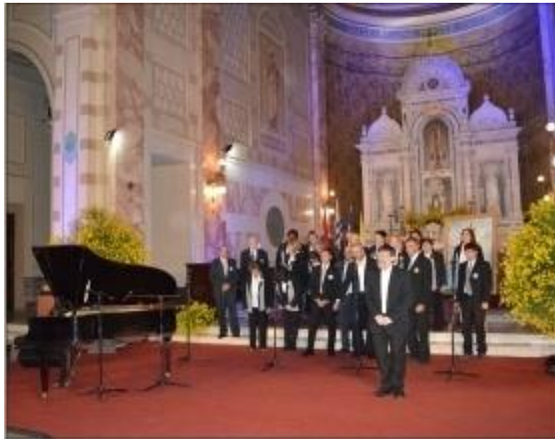
Imagen N°9 - Concierto “Uruguay le canta a la Virgen de los Treinta y Tres” (Florida).