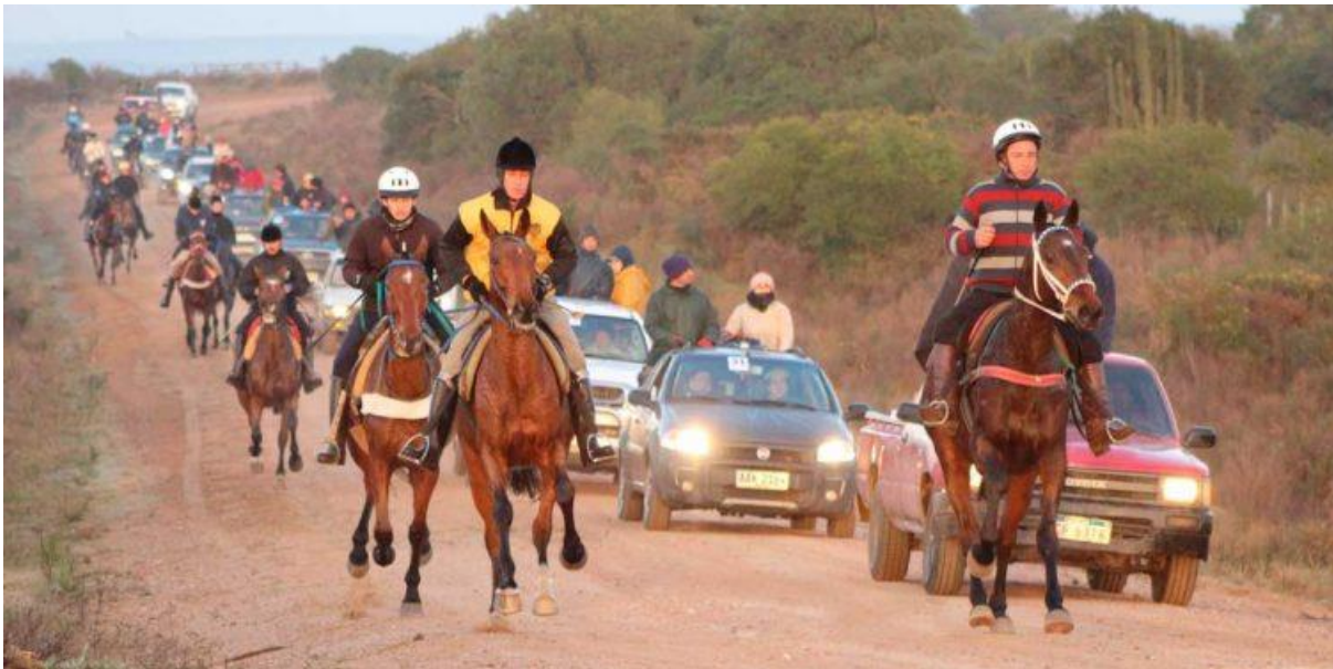
Imagen N°1–Disputa de la competencia raid hípico organizado por la FEU.