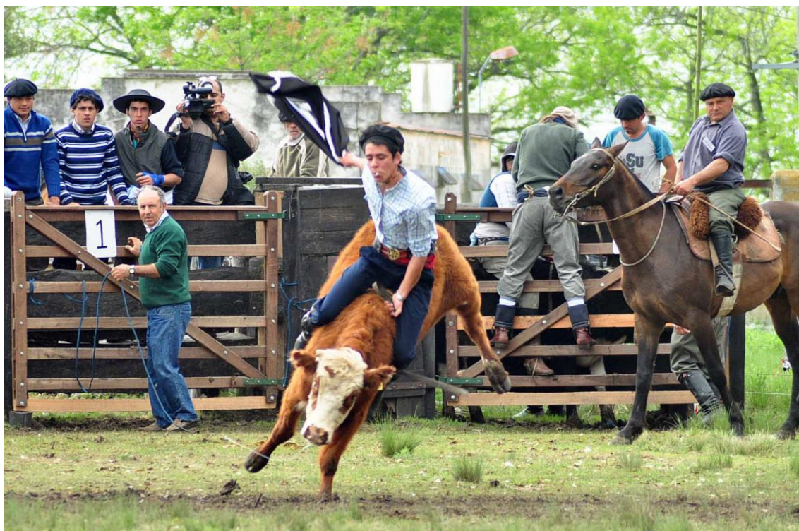
Imagen N°2–Jineteada vacuno en la “Fiesta del Ternero” en Goñi (Florida).