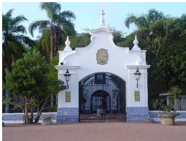
Imagen N°12 - Fachada de la Estancia Turística San Pedro de Timote. (Cerro Colorado).

La IDF, en su plataforma impulsa la "Ruta del Caballo y del Jinete" sobre Ruta Nacional N°5, vinculando las localidades de Sarandí Grande, La Cruz, Puntas de Maciel y Goñi. La temática que aborda es dar a conocer las festividades y el valor arquitectónico que presentan los sitios. Asimismo, la IDF añade la "Ruta de las Serranías" por Ruta N.º 7, pasando por Cerro Colorado, Illescas, Valentines y Nico Pérez, llegando a Cerro Chato. El viaje permite apreciar, mangueras de piedras, campos forestados y serranías onduladas.