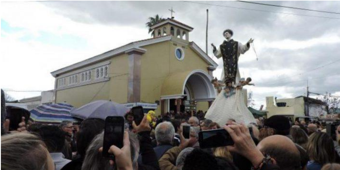
Imagen N°7 –San Cono en procesión. De fondo la Capilla. (Florida).