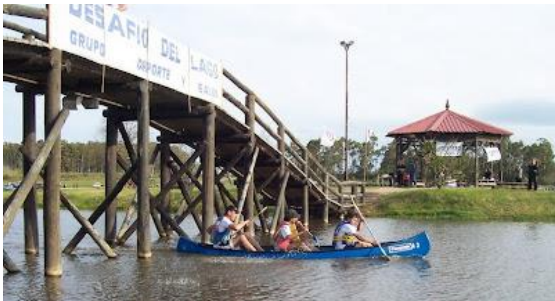
Imagen N°7 – Evento “Desafío del Lago” en el Parque Tomas Berreta de Sarandí Grande (Florida).