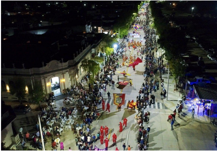
Imagen N°5 - Desfile de Carnaval en Sarandí Grande (Florida) por Av. Artigas.