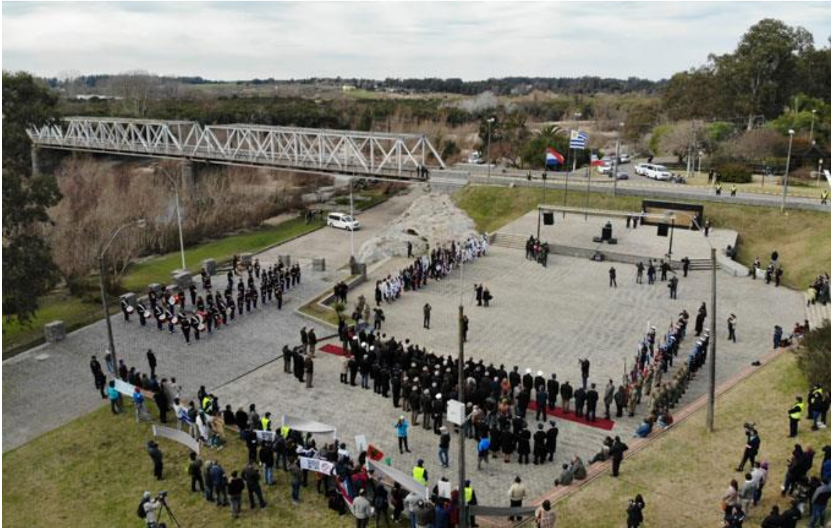
Imagen N°16 – Vista aérea del Puente Piedra Alta y explanada del Prado Español en la ciudad de Florida (Florida).

referencia para diagnosticar los acontecimientos fue digno de admiración, entendiéndolo las limitaciones que se tiene al momento de conformar el producto.