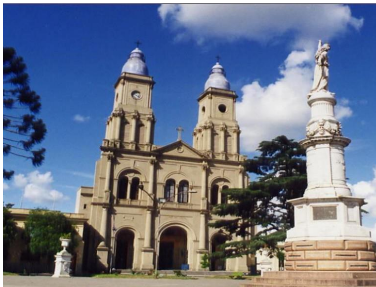
Imagen N°8 - Vista desde la Plaza Asamblea de la Catedral Basílica de Florida y Santuario Nacional de la Virgen de los Treinta y Tres Orientales, y monumento a la Independencia Nacional. (Florida).