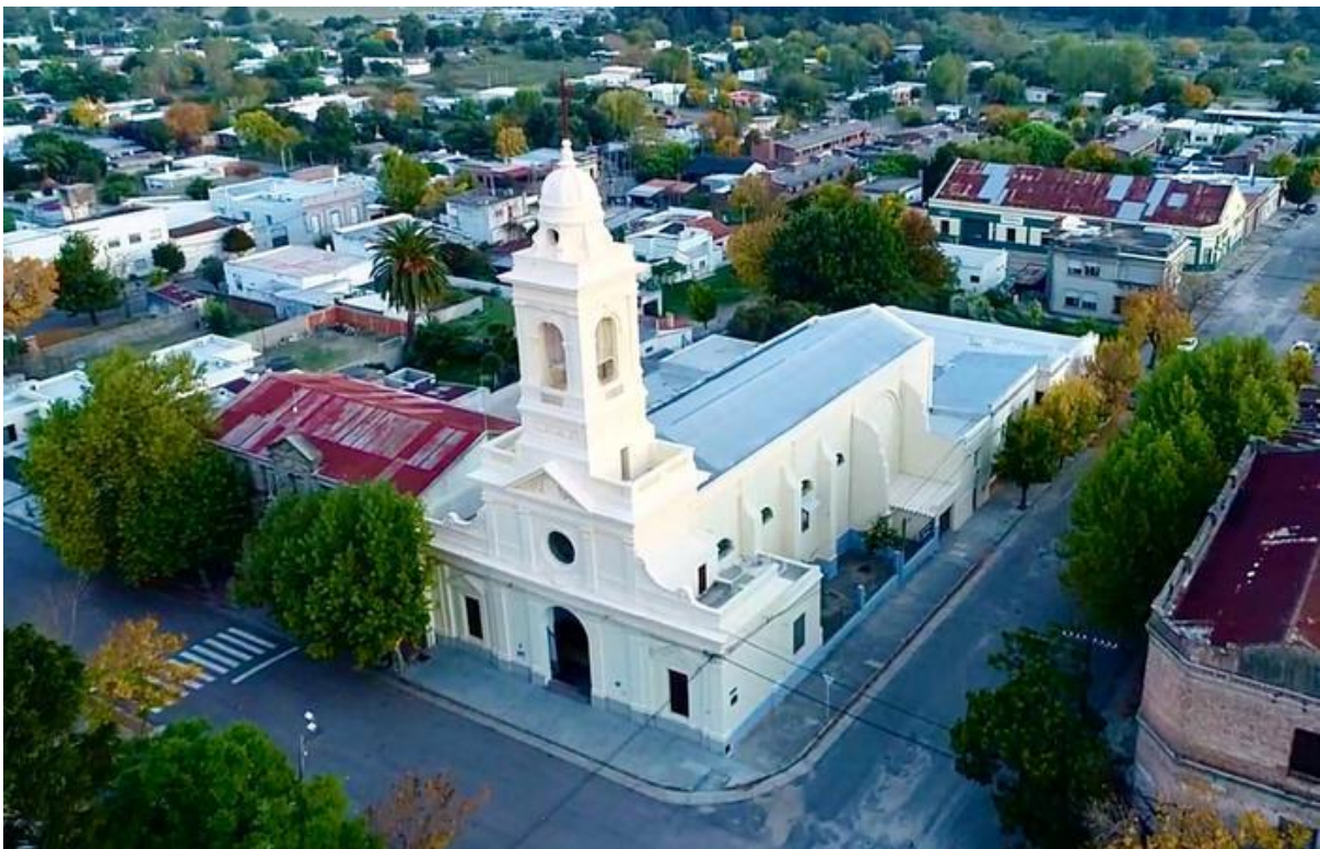
Imagen N°10 – Parroquia Nuestra Señora del Pilar. Sarandí Grande (Florida).