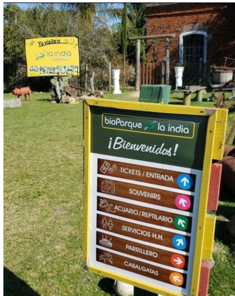
Imagen N°15 – Entrada principal del bioparque “La India”. La Macana (Florida).