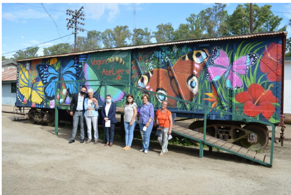
Imagen N°11 – Vagón Atelier de 25 de Agosto (Florida).