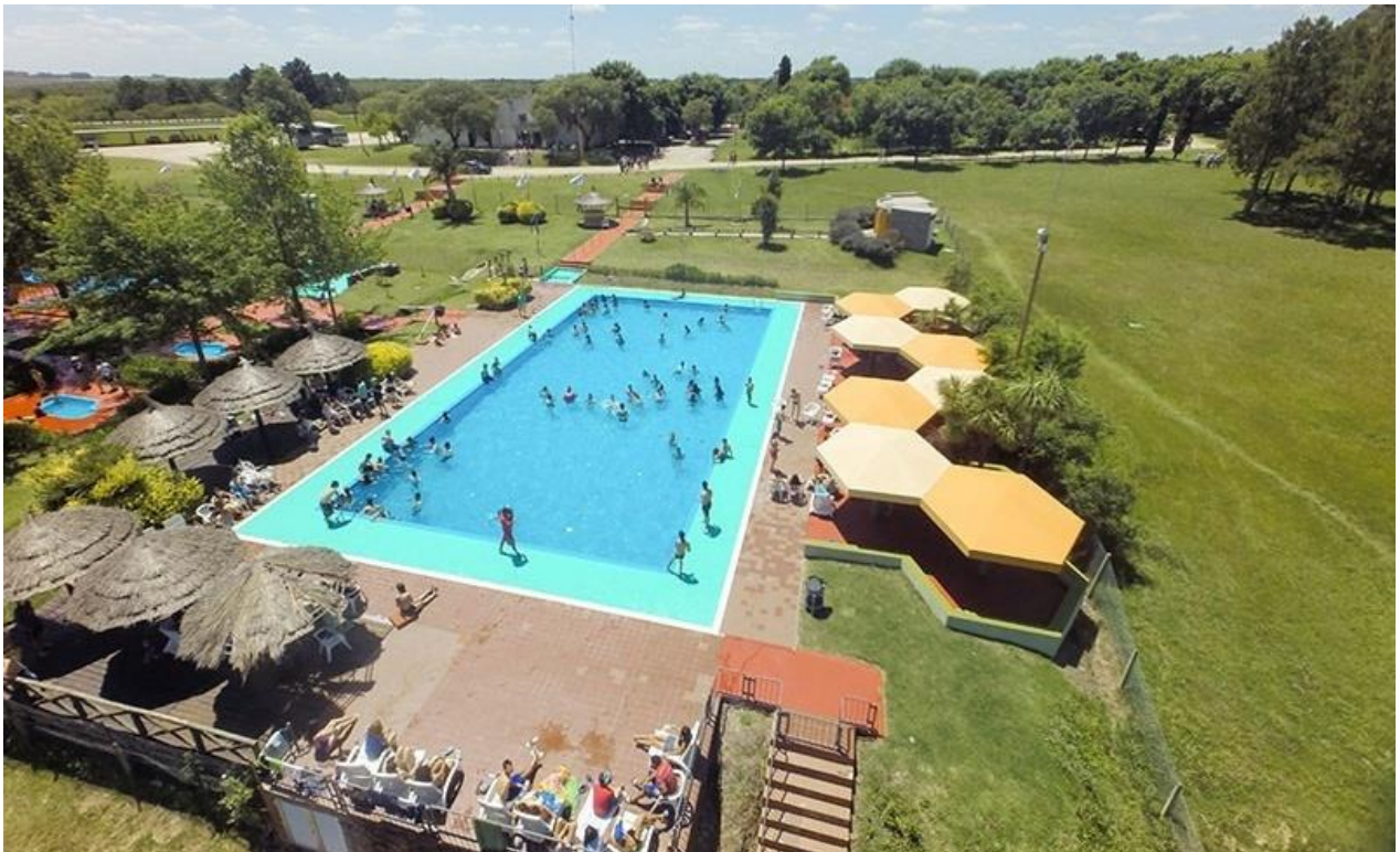
Imagen N°14 – Centro de Recreación Paso Severino (Florida). Vista de la piscina central.

El Centro de Recreación Paso Severino (Florida) ( www.pasoseverino.com ), se encuentra a orillas del río Santa Lucía Chico, en el km 73 de la ruta N°5. El establecimiento ofrece una propuesta única en el departamento, abarcando servicios de alojamiento, salas de juegos, piscina al aire libre, parrilleros, salón comedor y de actos. Es una buena escapada de fin de semana, ideal para los que vacacionan en familia, ya que hay cantidad de entretenimientos para niños y grandes. El destino es perfecto para cualquier época del año, los servicios que ofrece están pensados para disfrutar de los días templados, pero también para pasar un cómodo fin de semana largo de invierno.