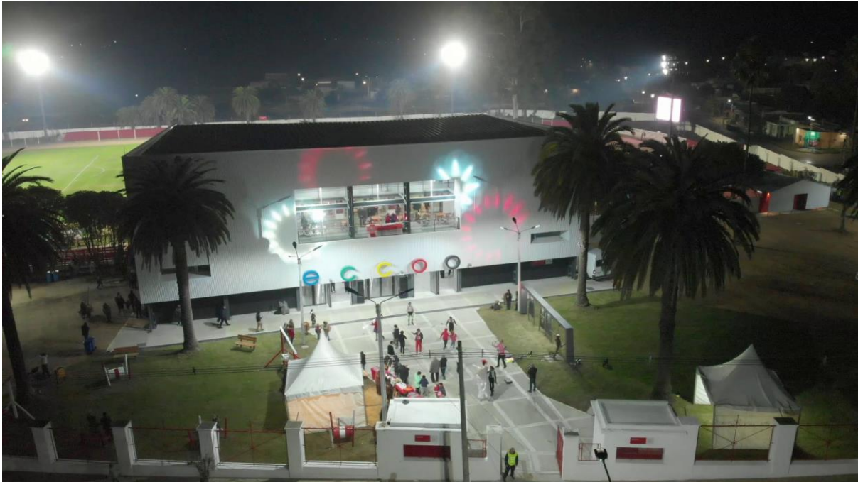
Imagen N°6–Estadio “Campeones Olímpicos” (ECO).