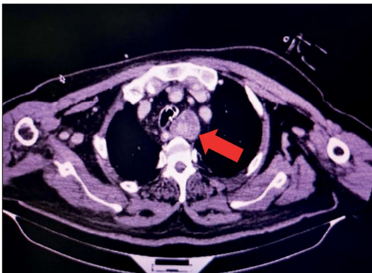
Figura 2. Tomografía de cuello. En contacto con extremo inferior izquierdo de glándula tiroidea se observa gran tumoración mediastinal ovoidea, que se localiza lateral a la tráquea y medial al cayado aórtico, de densidad heterogénea (flecha roja). Mide aprox. 80 x 29 mm L x AP.