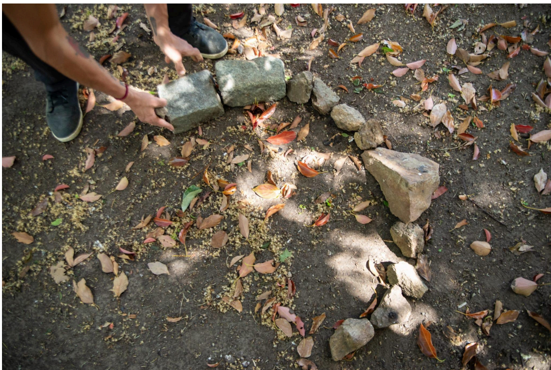
Fig. 6. Delimitación del terreno para hacer el fuego, elemento presente en la mayoría de los rituales.