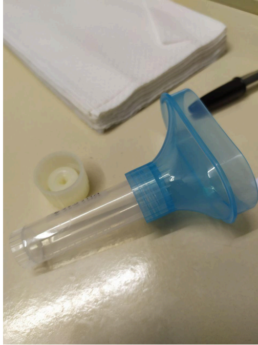
Fig. 3. Instrumento utilizado para tomar la muestra de saliva para la prueba de ADN mitocondrial en el laboratorio de Antropología Biológica.

En lo personal, se trató de una experiencia bastante conmovedora, ya que mi interlocutora no contaba con la memoria oral ni los marcadores morfológicos mencionados anteriormente. Para ella, el ser charrúa se trata de pertenecer a la comunidad, identificarse con la causa y querer buscar sus raíces, sobre las cuales siempre supo, siempre se le transmitió en silencio pero nunca se preguntaba al respecto (Diario de campo, noviembre de 2022).