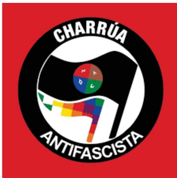
Fig. 8. Logo de Charrúa Antifascista.

“Antifascista, antirracista, antipatriarcal. Por la justicia histórica, social y ambiental, por los derechos de la nación charrúa y el buen vivir” , así se define el instagram de Charrúa Antifascista, quien cuenta al momento, en agosto de 2024, con un total de aproximadamente ocho mil seguidores. Allí se establece también que no se trata de una organización en particular, sino de una expresión ideológica y símbolo al servicio de quien desee usarlo.