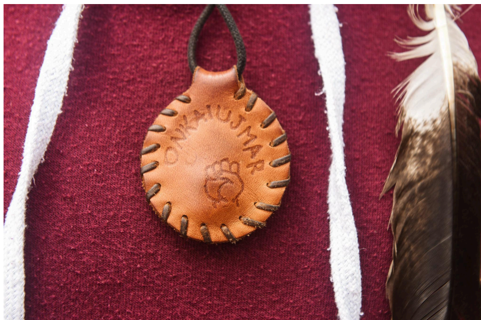
Fig. 9. Guayaca.

pluma y mostrarme yo con la vincha, yo lo siento como acá estoy, acá estoy. Y que todo lo que nos rodea y lo que nos ve, que nos vea como lo que somos, que nos vean y que acá estamos. Y es una forma también de visibilizarse en esos lugares. O sea, que te guste o no, estamos y vamos a seguir estando, estamos acá” (Diario de campo, octubre 2022).