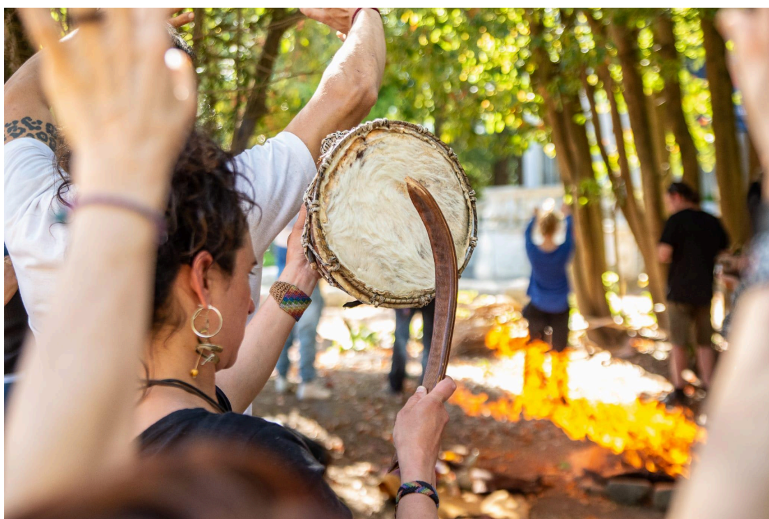
Fig. 4. Ritual de invocación a los ancestros a las cuatro direcciones. Se realiza como apertura de cualquier actividad, evento o ceremonia.

Para el contexto específico de la comunidad charrúa Jaguar Berá, los rituales juegan un papel importante en la construcción de la identidad y la espiritualidad indígena. Utilizando la clasificación propuesta por Arce (2018), nos encontramos entonces ante rituales de conexión con la tierra (danzas e invocaciones de espíritus y seres del monte), rituales de resistencia y reivindicación (participación en marchas y movilizaciones, ceremonias asociadas a la naturaleza y los ancestros en lugares y eventos públicos) y rituales de memoria y recuperación (invocación de ancestros, revitalización del idioma).