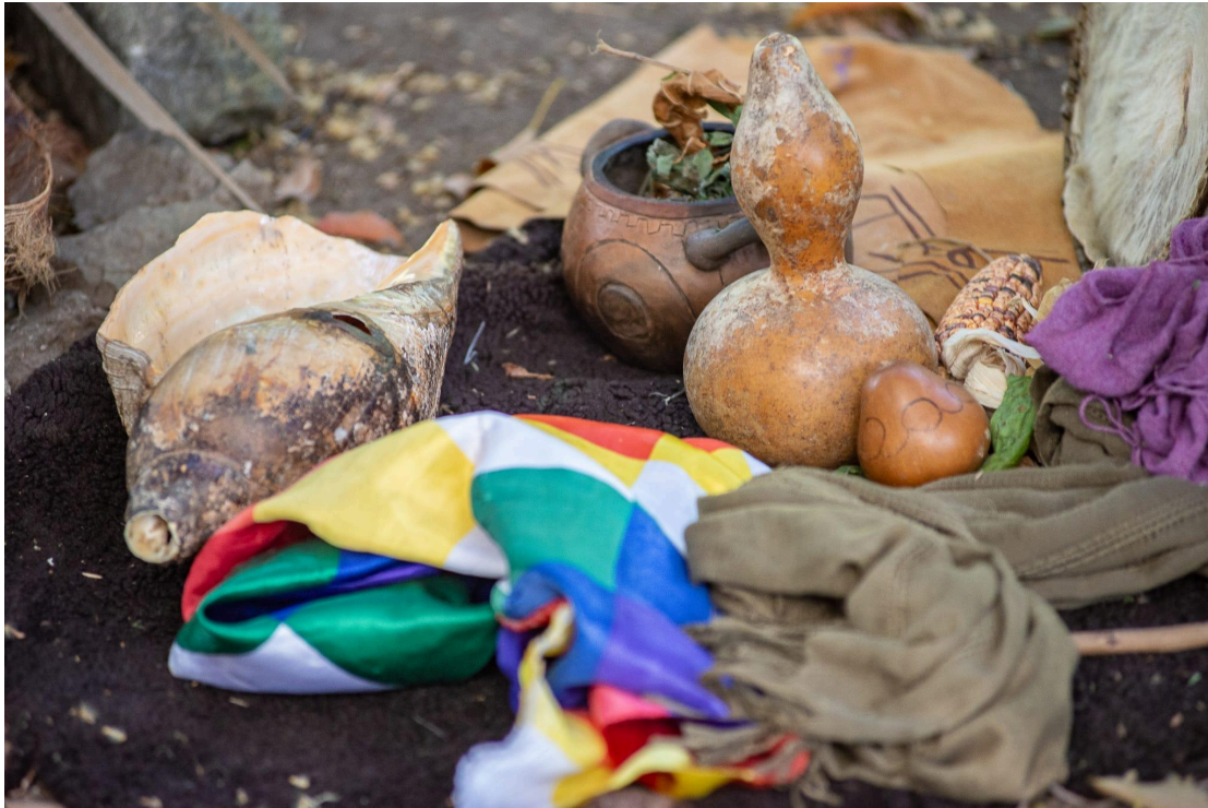
Fig. 5. Elementos presentes en el ritual de invocación a los ancestros a las cuatro direcciones. De izquierda a derecha: caracol (se utiliza como instrumento de viento), Wiphala (bandera emblema de los movimientos indígenas latinoamericanos), porongo, cuenco con hierbas, quillapí (tipo de sacón elaborado con cuero y sobre el cual se realizan ilustraciones).