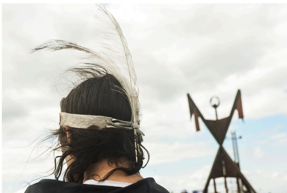
Fig. 10. Pluma y vincha. Al fondo: monumento “Memorial a la Nación Charrúa” a orillas del Arroyo Salsipuedes Grande.