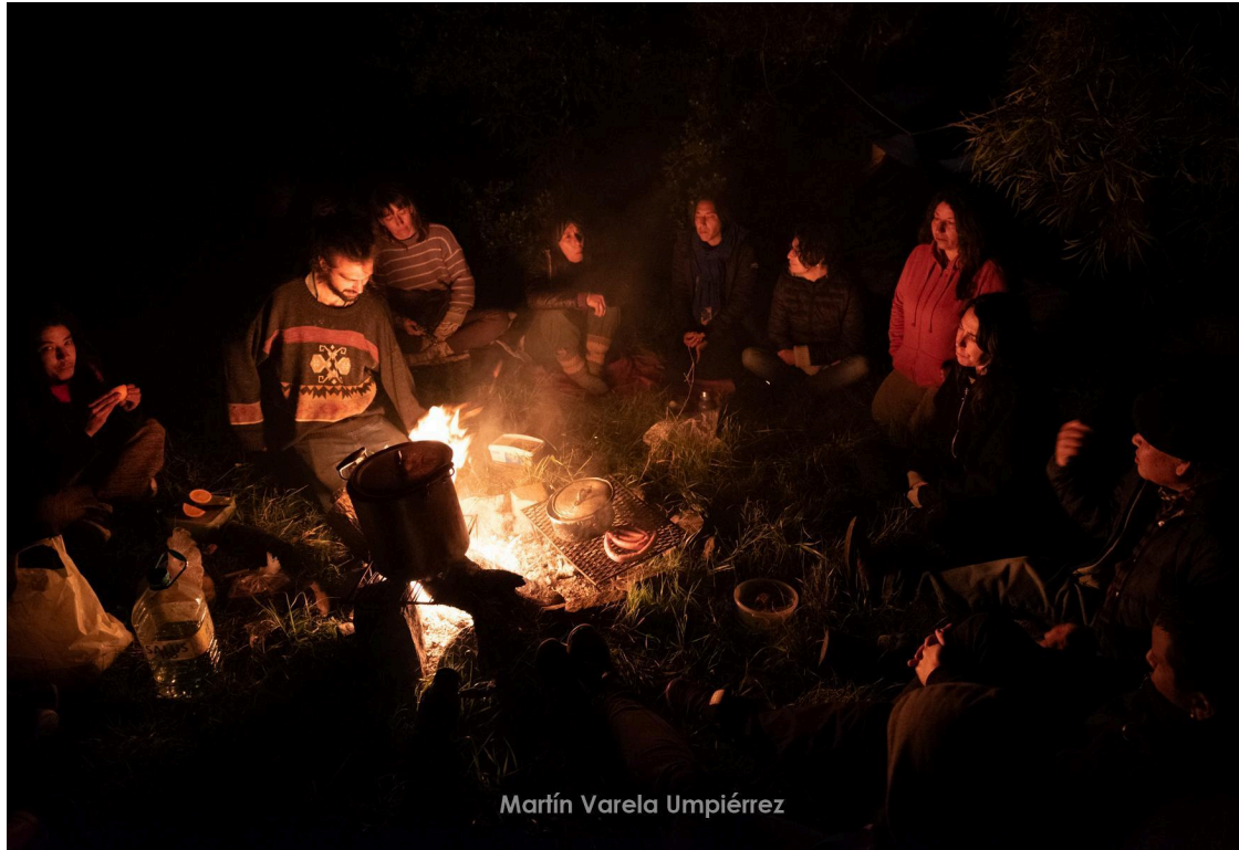
Fig. 13. Fogón del campamento.