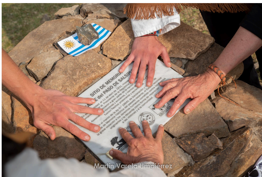
Fig. 12. Placa colocada en la declaración de la Masacre del Paso Salsipuedes como Sitio de Memoria.

A través de la Comisión Nacional Honoraria de Sitios de Memoria del Instituto Nacional de Derechos Humanos, en el año 2021, ADENCH, CO.NA.CHA., Hum