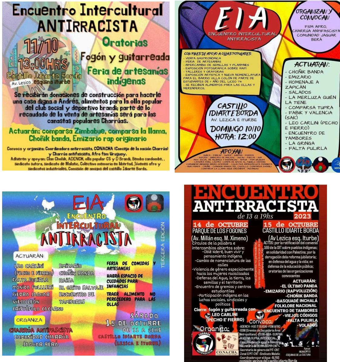
Fig. 11. Afiches de difusión de los EIA. De izquierda a derecha, ediciones 2020, 2021, 2022 y 2023.

Otro de los espacios donde se evidencia lo político, y las dos dimensiones de la lucha de la comunidad Jaguar Berá (Kropff, 2007) son los Encuentros Interculturales Antirracistas (EIA de ahora en más).