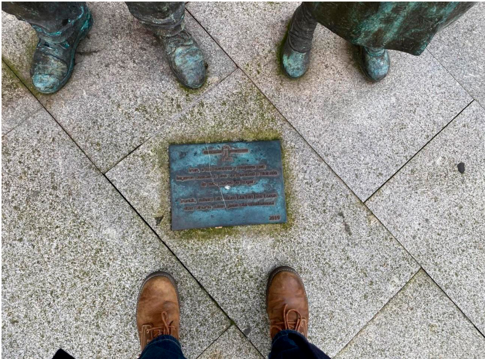
Foto tomada en el contexto de la investigación en febrero de 2025. Placa de «Irún, a los hombres y mujeres que llegaron buscando una oportunidad e hicieron de esta ciudad su hogar».

El activista vasco que nos oficia de guía también añora que ya no se juega al frontón tanto como al fútbol. Entienden que en el deporte global se encuentran los niños migrantes y locales, aunque, como dijo mientras bajábamos una escalera desde la que se veía un viejo frontón, bien le gustaría verlos ejercitándose en los viejos deportes vascos. Es fuerte la emoción que produce encontrarse con nacionalistas tan universales.