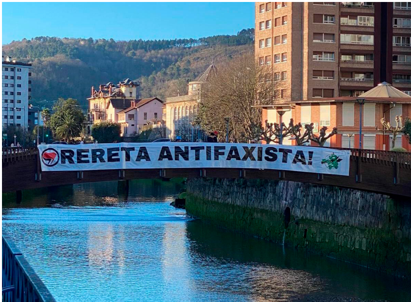
Foto tomada durante el trabajo de campo en febrero de 2025, a propósito de la manifestación en repudio a Vox en Rentería convocada por vecinos a través de la plataforma Orereta-Errenteriako Herri Ekimena, bajo el lema «Frente a la ofensiva fascista, libertad».

La defensa de la democracia es una prioridad. Por eso, las agendas reaccionarias contra los derechos y libertades de la ciudadanía y de los pueblos no tienen cabida en nuestro municipio (...) Hemos recorrido un largo camino en la defensa de los derechos y las libertades. Por ello, hacemos un llamamiento para que cada cual desde su ámbito siga cohesionando la comunidad y profundizando en los valores democráticos.