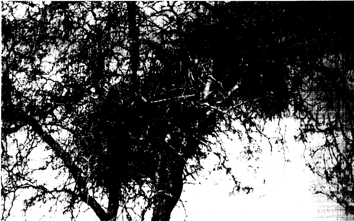
Figura 2. Nido de Anumbius annumbis annumbis en un árbol de Acacia caven , "espinillo".

descrita, de vegetación característica, siempre asociado a aves.