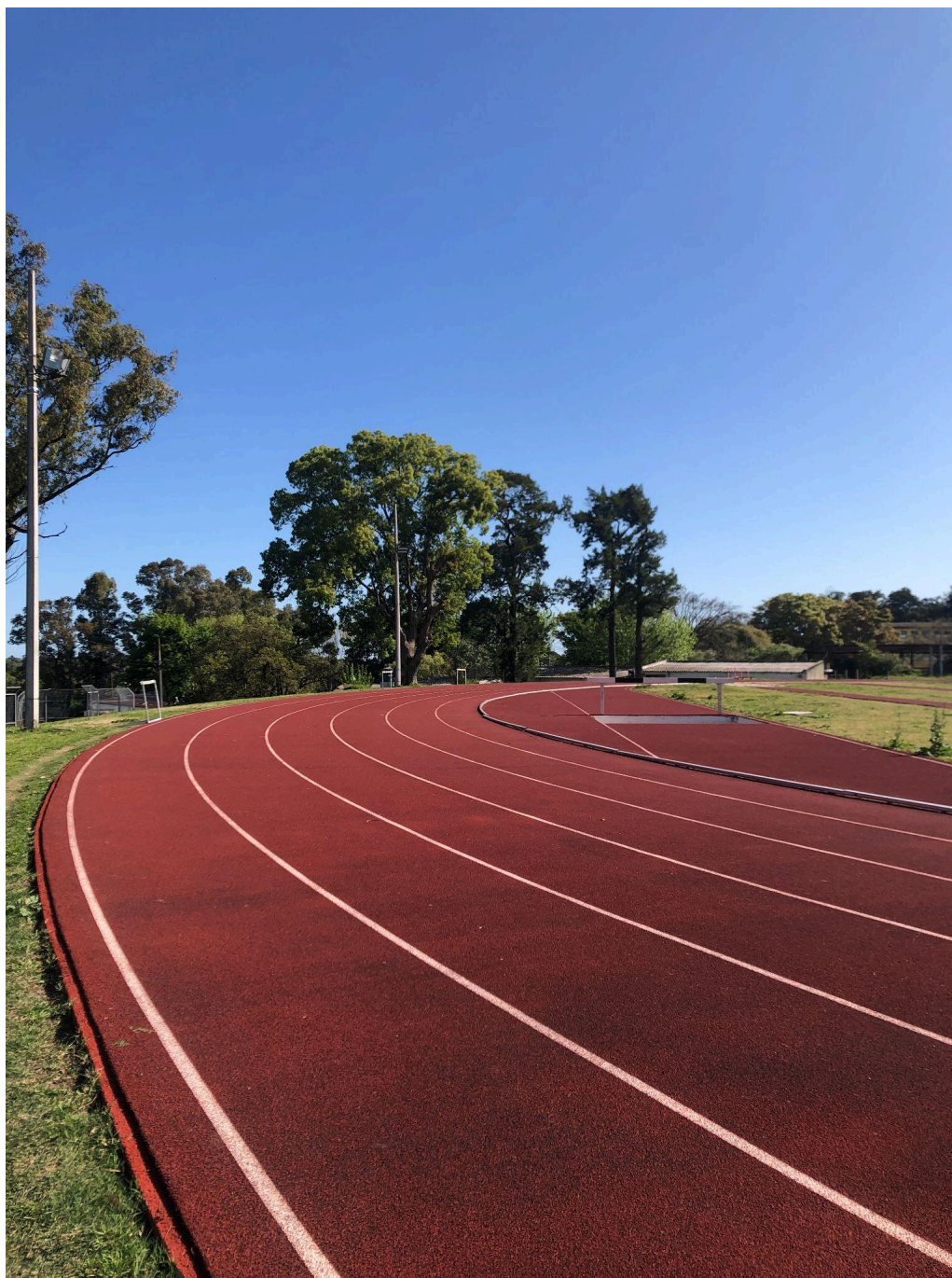
Pista de atletismo del Prado, Montevideo.

Los deportistas uruguayos de atletismo, natación y remo, mantienen rutinas de alto rendimiento, compiten internacionalmente sin figura profesional ni cobertura previsional que les permita vivir de su disciplina