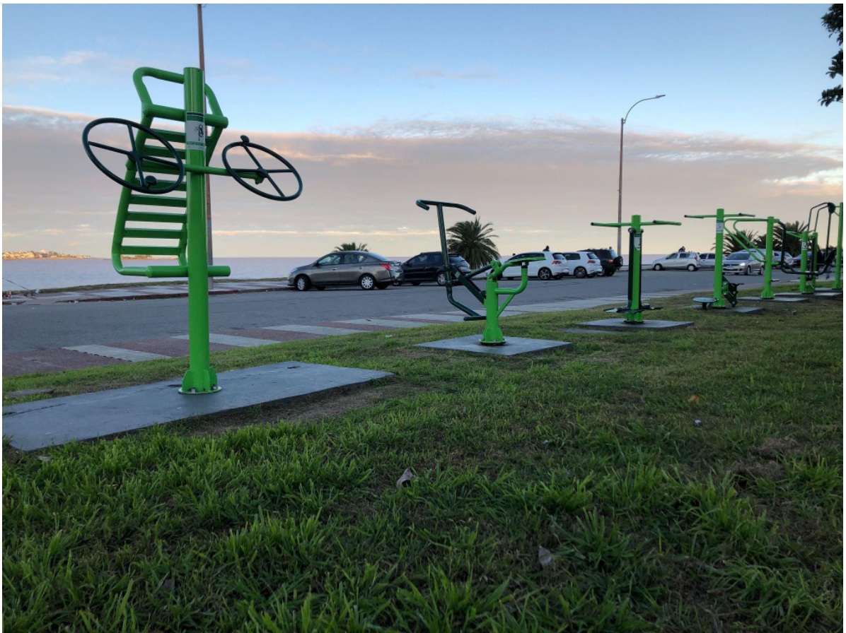
Figura 2 - Equipamiento saludable

“Equipamiento saludable” ubicado al lado del Museo Zoológico Dámaso Antonio Larrañaga - Fotografía propia.