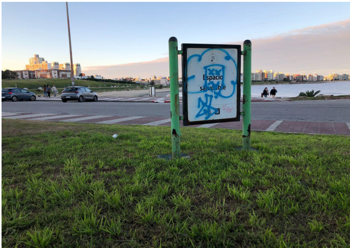
Cartel de “Espacio saludable” colocado junto al equipamiento correspondiente al lado del Museo Zoológico Dámaso Antonio Larrañaga - Fotografía propia, 19 de mayo de 2024.