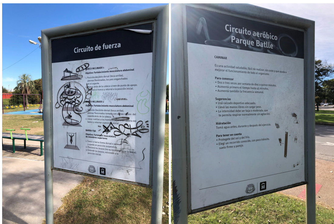
Carteles con instrucciones para el uso de “juegos saludables” en el Parque Batlle 20 de mayo de 2024