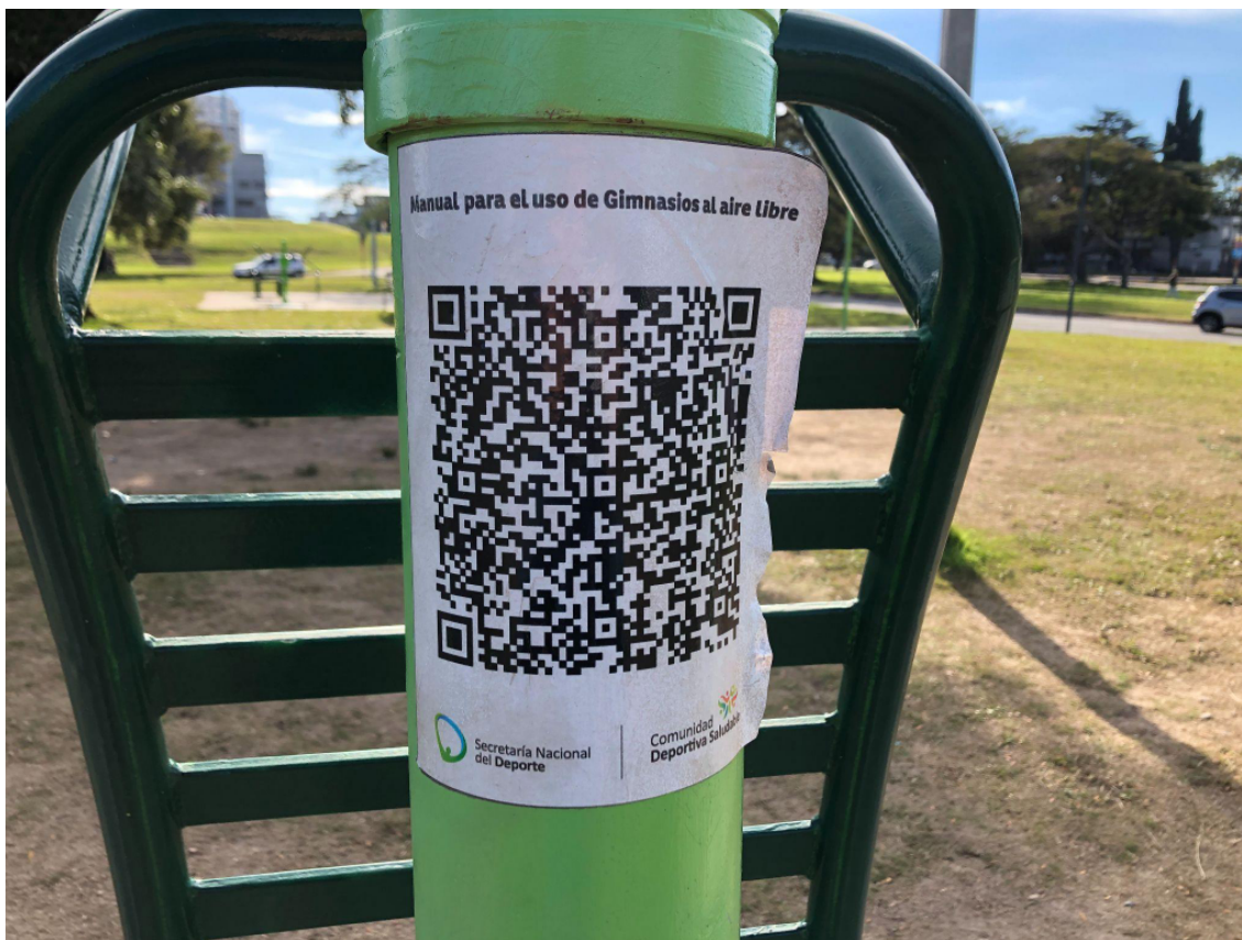
Figura 4 - Código QR: manual para el uso de “Gimnasios al aire libre”

Código QR pegado por la Secretaría Nacional de Deporte en un “aparato saludable” en Parque Batlle 20 de mayo de 2024.