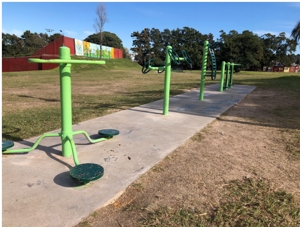
Aparatos “saludables” instalados en el Parque Batlle 20 de mayo de 2024.

Lo interesante de este dato es que tanto el gobierno nacional, como el departamental y los distintos gobiernos municipales -incluso se han encontrado demandas de colectivos a través de presupuestos participativos- coinciden en una mirada positiva sobre su aumento en la ciudad. Pareciera que hay una mirada única sobre el gobierno de los cuerpos en la ciudad, sin diferenciar ideologías partidarias. Parece que lo que opera es la propia reproducción de la política moderna. Desde su preocupación por las políticas de salud pública Castiel, Guilam y Ferreira (2010) advierten esto señalando que las políticas enfocadas en el cambio de los comportamientos de los individuos son más una forma de protección de las instituciones que una búsqueda por el cambio en las condiciones de salud de la población.