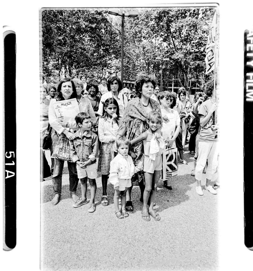
Acto por el Día Internacional de la Mujer, 8 de marzo de 1987

El desarrollo del feminismo en Uruguay estuvo influido por los medios de comunicación que se crearon en el retorno del exilio, el cual trajo nuevas miradas desde un enfoque feminista que desafió el orden tradicional e instaló la lucha por el deseo y la autonomía femenina. En la actualidad, los órganos de prensa feministas se han desdibujado a secciones dentro de medios tradicionales, y el mundo digital es el espacio donde se concentra la militancia feminista