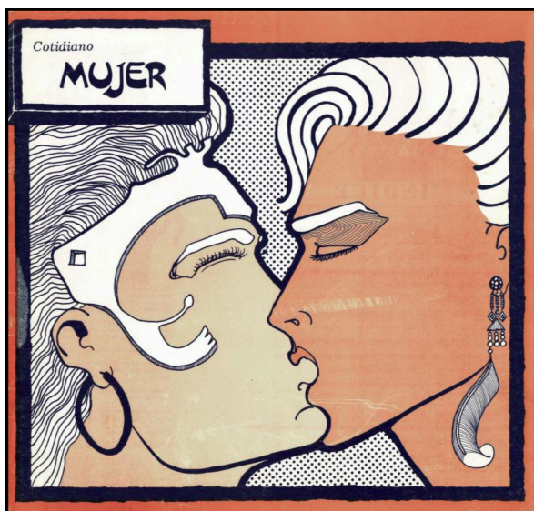
(Portada - Cotidiano Mujer 2da Época N 2 Marzo 1991)