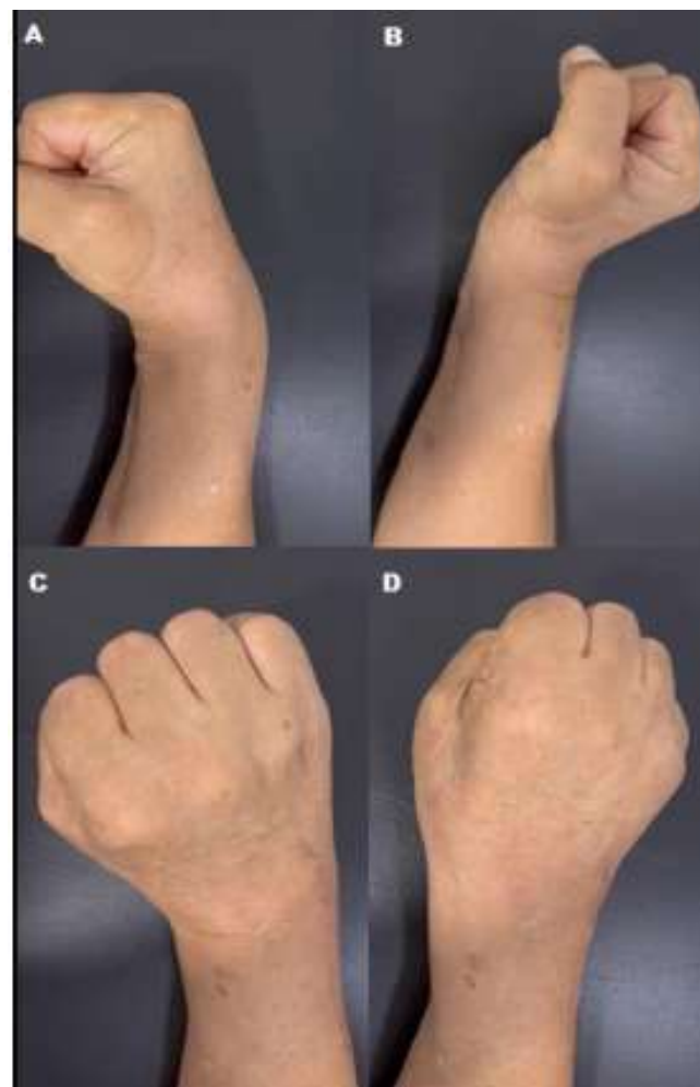
Figura 3. Movimientos biomecánicos de la articulación radio carpiana A. Flexión. B. Extensión C. Desviación radial. D. Desviación ulnar.

Luego de la intervención quirúrgica, se ordenó un plan de rehabilitación en tres fases, que consistía en tres semanas de inmovilización, posteriormente movilización pasiva y uso de órtesis de muñeca de tres a 8 semanas. A las 8 semanas de la cirugía iniciaron la rehabilitación funcional con movilidad activa durante 10 días, teniendo como resultado efectivo de la biomecánica anatómica (Figura 3). El paciente acudió a control a los tres meses con ortopedia y se encontró al paciente con adecuada flexión, extensión, desviación cubital, desviación radial, pronación y supinación de la muñeca.