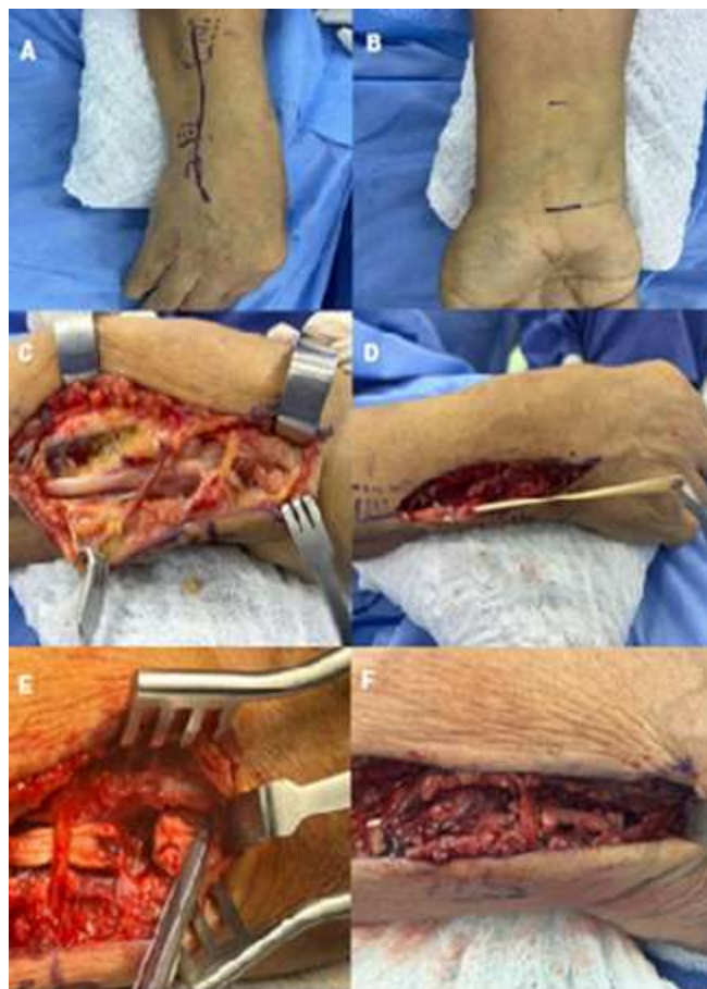
Figura 2. A: Marcate de ubicación del territorio del ECU, B. Abordaje tendón palmaris longus. C: Ruptura Extensor Carpo Ulnaris. D: Sutura tipo pulvertaft de cosecha palmaris longus. E. Reinserción en base del quinto metacarpiano con sutura de anclaje, F. Puntos de krakov y sutura del cabo distal a través y alrededor del injerto.

cabo distal. Inmovilización con férula antebraquimetacarpiana en extensión del puño sin bloqueo de la pronosupinación. El procedimiento es descrito sin complicaciones.