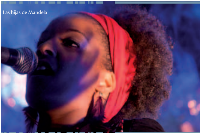
Las hijas de Mandela