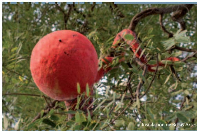
Instalación de Bellas Artes