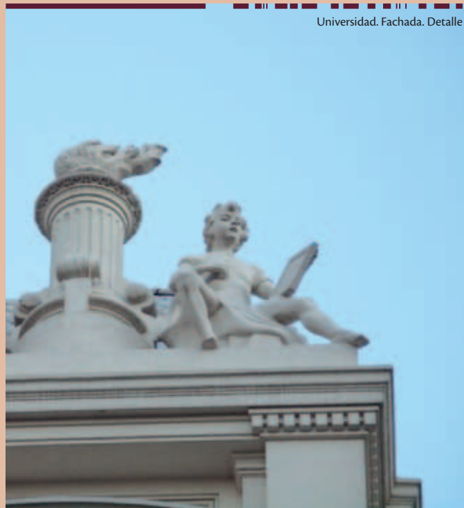
Universidad. Fachada. Detalle

creación de nuevas instituciones públicas de carácter terciario”, el CDC, “en forma clara y explícita, ha manifestado su intención de no tener el monopolio de la educación terciaria y universitaria pública en nuestro país”, y que por lo tanto, los desacuerdos manifestados en distintas ocasiones “no están basados en ninguna pretensión de exclusividad sobre la educación terciaria por parte de la Universidad de la República”.»