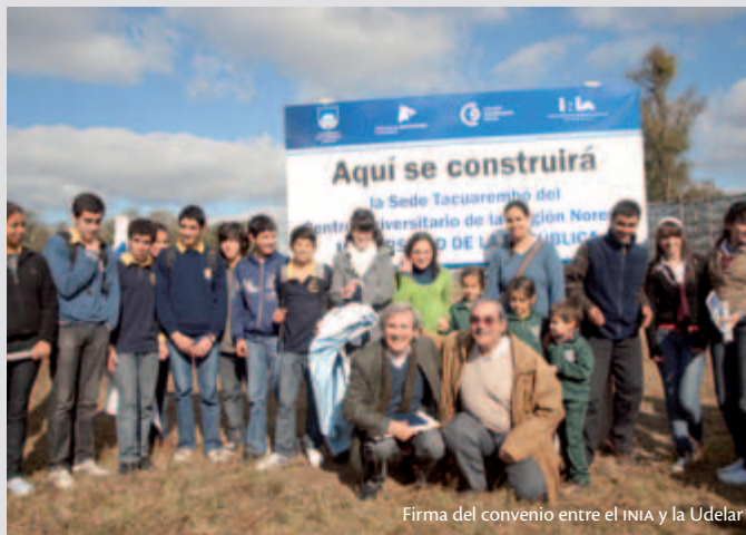
Firma del convenio entre el INIA y la Udelar

Se aprobó el convenio por el cual la Udelar y el Instituto Nacional de Investigación Agropecuaria (INIA) construirán un campus conjunto en el predio del INIA Tacuarembó. El mismo estará destinado a la creación de un nuevo Centro Regional Universitario (Cenur), así como también la creación de un Centro de Investigaciones INIA-Udelar. Ambas instituciones han afirmado su intención de colaboración y la apertura del campus hacia otras instituciones.