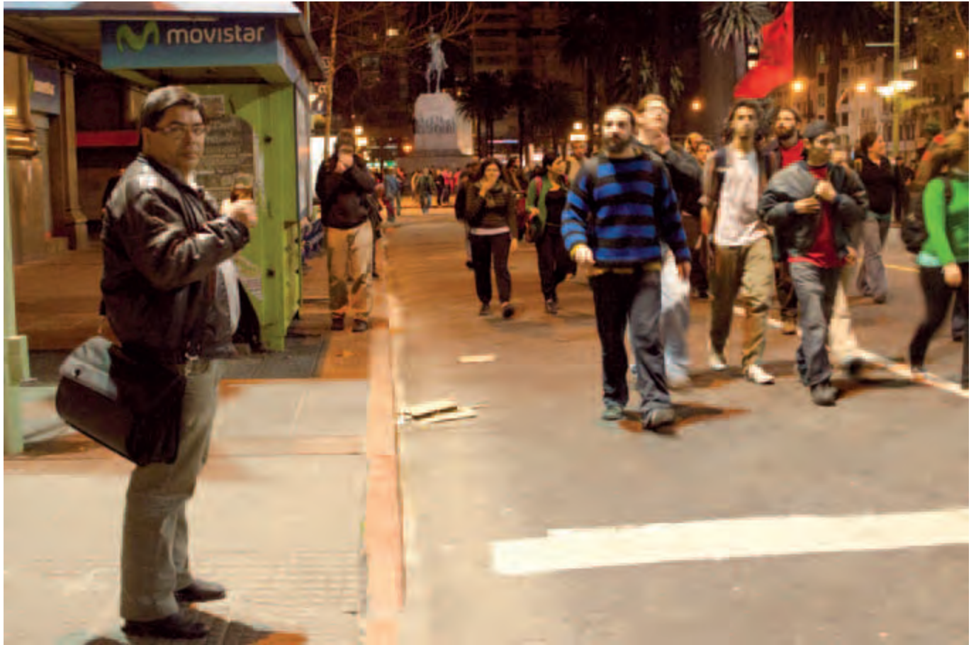
Final y retorno hacia la explanada de la intendencia de la marcha en apoyo a los estudiantes chilenos organizada por la FEUU y la OCLAE en el marco de CLAE en Montevideo. Avenida 18 de Julio y Andes. Agosto de 2011. Montevideo.