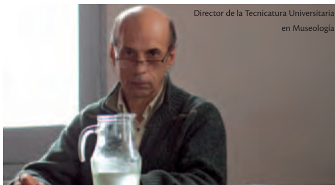
Director de la Tecnicatura Universitaria en Museología