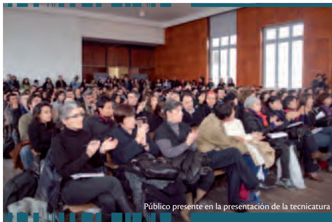
Público presente en la presentación de la tecnicatura

En nuestro país hay aproximadamente 150 museos, entre los nacionales, departamentales, locales e institucionales, pero se carece de ámbitos específicos de formación para las tareas que el funcionamiento de los museos exige. Esto ha inhibido la renovación de muchos de los museos existentes, apegados a modalidades de funcionamiento y organización del público que derivan en la subutilización de las potencialidades de los acervos custodiados.