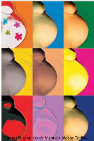
Fotografía gentileza de Manuela Aldabe Toribio.

La Casa de la Universidad de Tacuarembó (CUT) fue sede de la muestra Ingravid'arte : el arte se embaraza de la fotógrafa Manuela Aldabe Toribio. Ingravid'arte es un reportaje fotográfico que toma como fuente obras de arte que ya son clásicas, investiga y cuenta la maternidad en la Italia contemporánea. Mujeres madres de este nuevo siglo representadas con fotografías que aluden a Munch, Klimt, Picasso, Warhol o un actualizadísimo Miguel Ángel, jugando con cuerpos mientras se apropiación del arte y la maternidad.