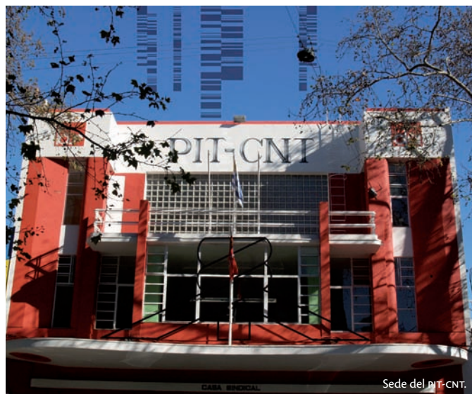
Sede del PIT-CNT.

El acceso a los estudios superiores debe estar abierto a quienes estén en condiciones de aprovecharlos, por haber completado la enseñanza media o por disponer de una formación adecuada y debidamente comprobada. Una nueva Ley Orgánica debiera posibilitarlo explícitamente. Ésta es una de las cuestiones sobre las que vale la pena debatir en profundidad.