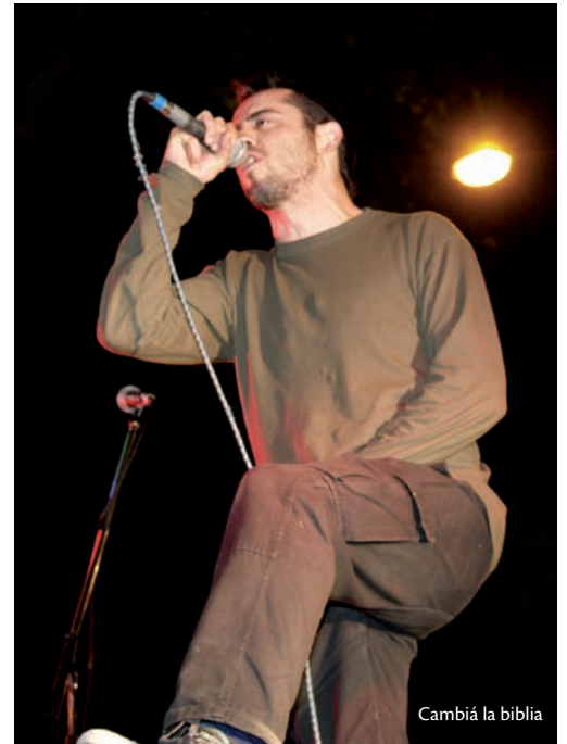
Cambiá la biblia