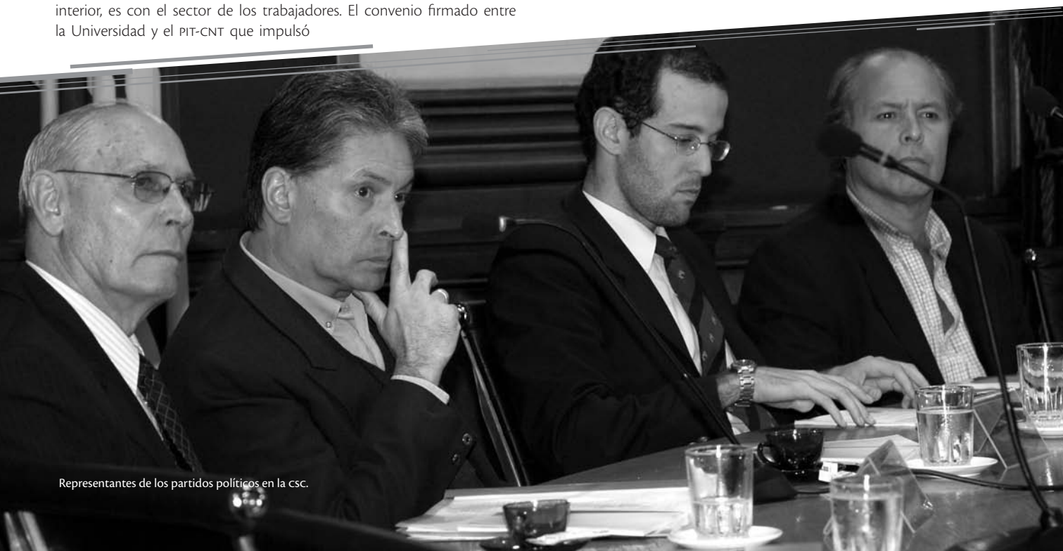
Representantes de los partidos políticos en la csc.