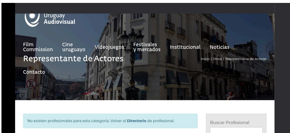
Figura 2. Directorio de profesionales del sector audiovisual - Representante de actores.

Nota: La imagen muestra una captura de pantalla de la sección Representante de Actores, del sitio web Uruguay audiovisual. (Uruguay Audiovisual, s.f. -c)