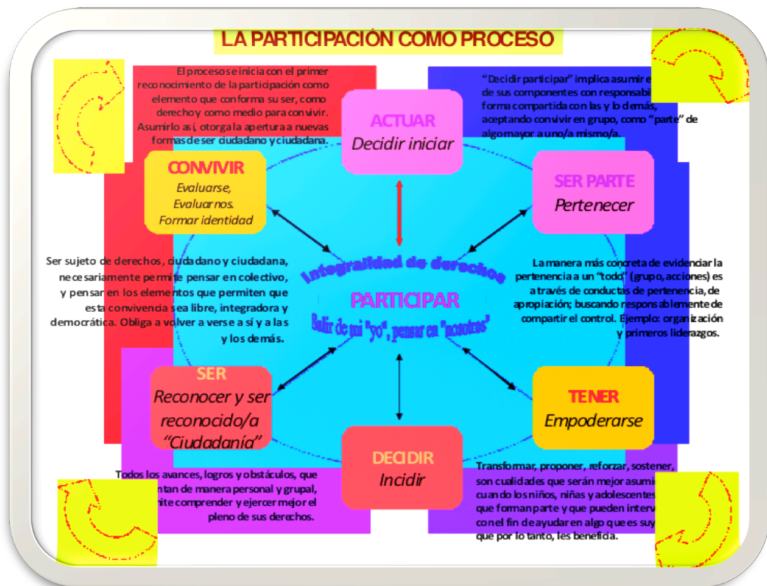
CUADRO1. PARTICIPACIÓN COMO PROCESO

El primer momento Participar identificado en el centro del cuadro remite a la primer iniciativa de encuentro con un otro, “salir de mi yo, pensar en nosotros”. Está vinculado a las prácticas de socialización, convivencia cotidiana, signficada como “etapa cero”, en función de su