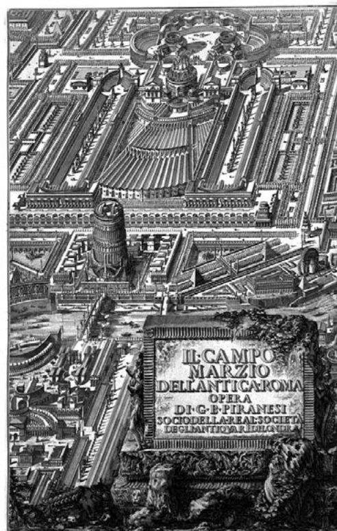
ILUSTRACIÓN 2. G. B. Piranesi, Il campo marzio , 1762

Las tres siguientes, por el contrario, constituyen aristas notablemente más específicas del continuum temático referido. Si las anteriores se enmarcaban en una novedosa manera de concebir el mundo, estas tres se enfocan en las formas nuevas de percibirlo . Un mundo pleno de riquezas de todo formato y especie; vasto pero, a la vez, crecientemente accesible; colmado de episodios poseedores de una nueva forma de belleza. Son, como es comprensible, tópicos derivados, en cierta forma, de la interacción de las anteriores, pero no por ello carecen de cualidades características.