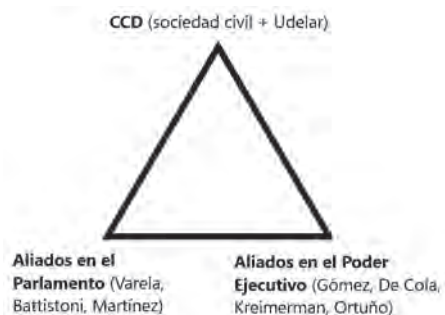
Figura 1. Triángulo de actores en el proceso de la LSCA