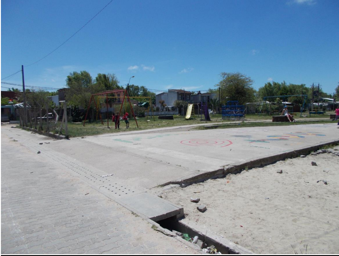
Ronzoni, S., Calles reparadas y cunetas de desagües