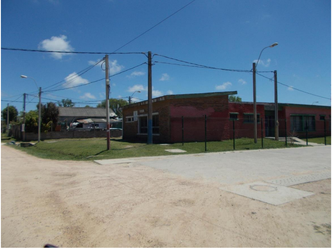
Ronzoni, S., Viviendas de realojo ya habitadas