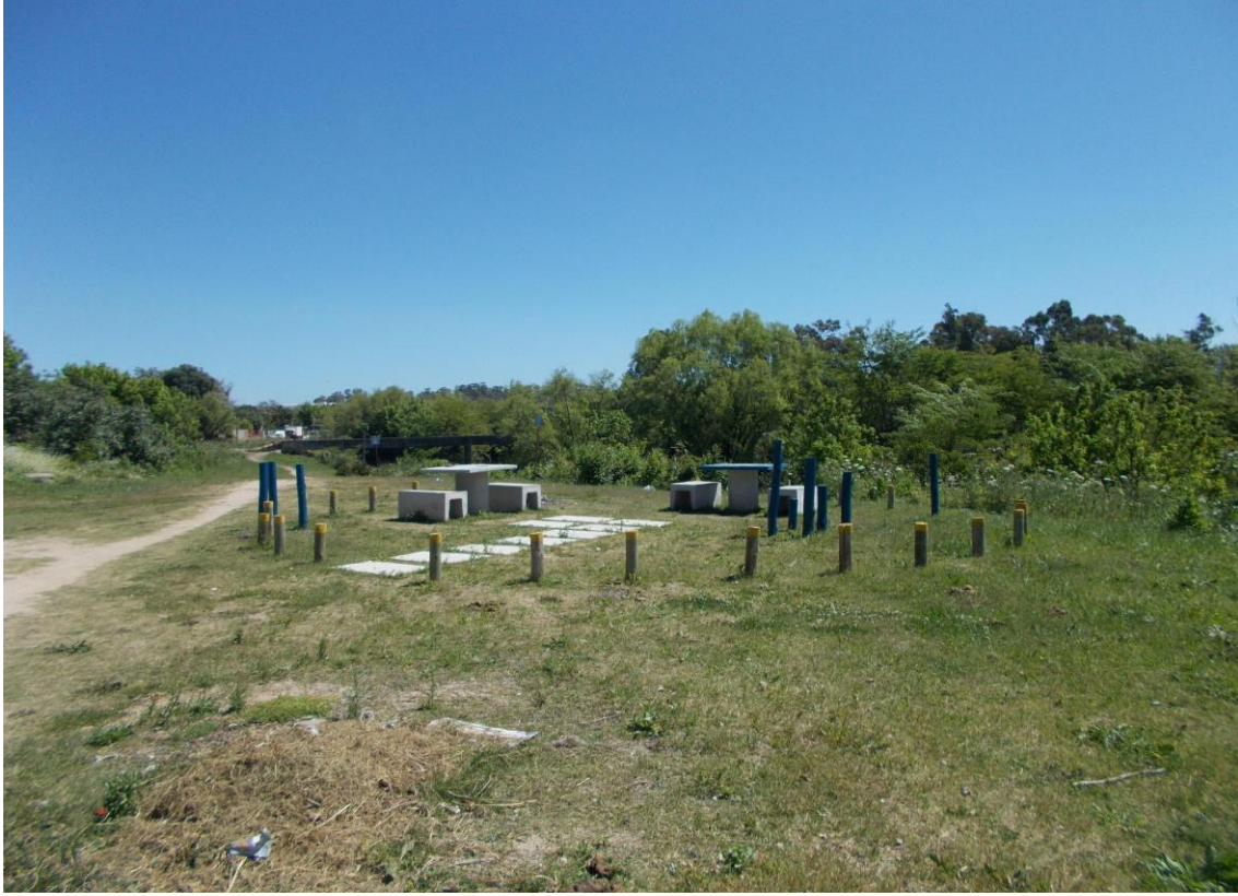
Ronzoni, S., Proyecto de construcción de parque en riberas del Arroyo Carrasco hacia el punto noreste

Viviendas en altura tipo edificio a los efectos de maximizer el terreno disponible segun la cartera de tierras habilitada