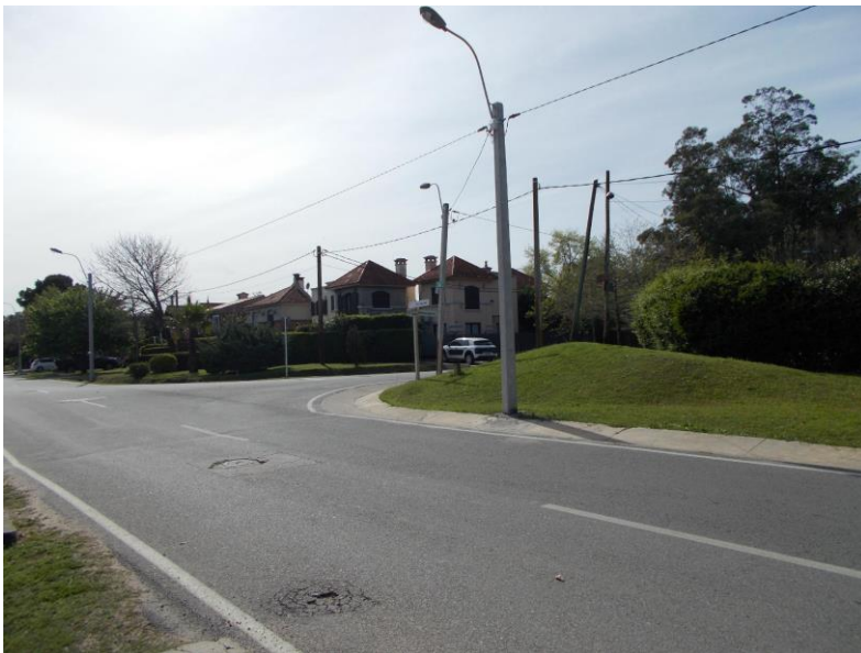
Ronzoni, S., Viviendas y calles de Parque Miramar