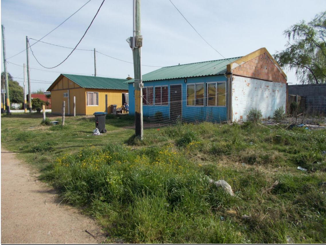
Ronzoni, S., Tipo de viviendas construidas para realojo