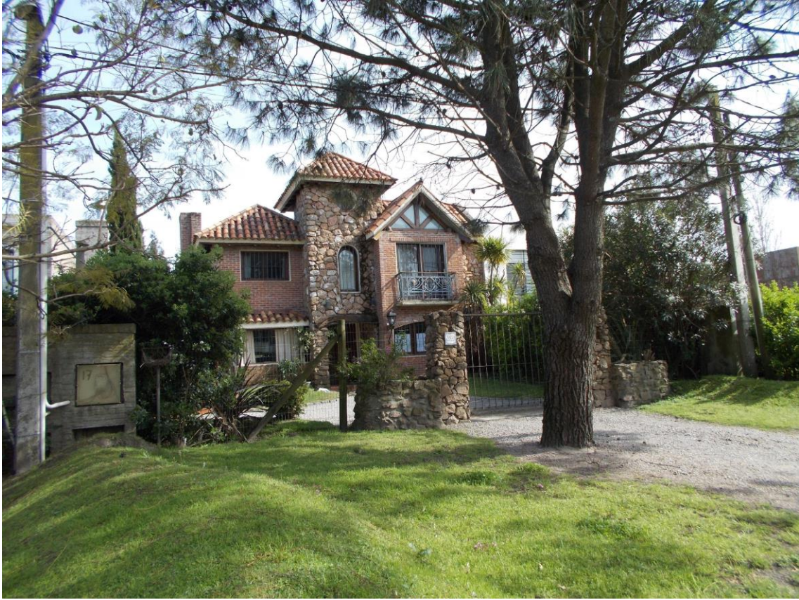
Ronzoni, S., Viviendas y calles de Parque Miramar