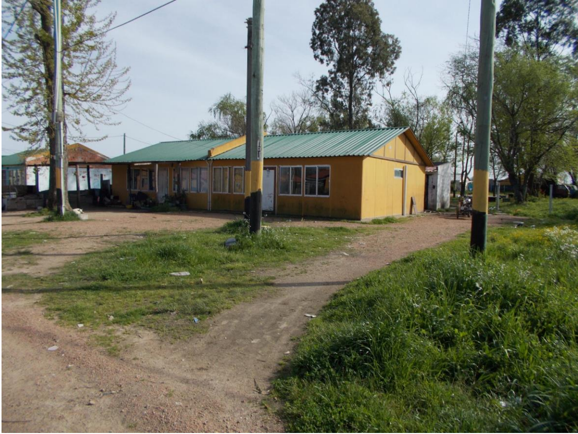
Ronzoni, S., Tipo de viviendas construidas para realojo