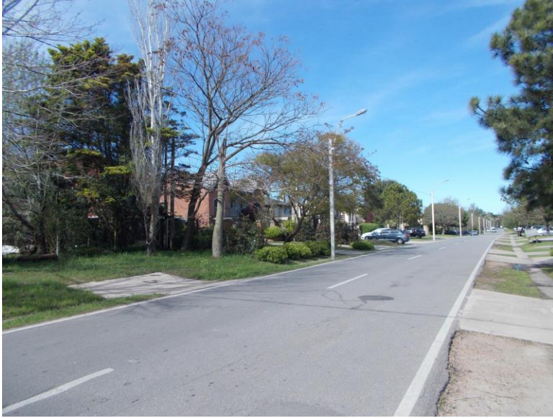
Ronzoni, S., Viviendas y calles de Parque Miramar