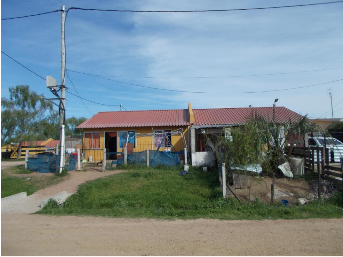
Ronzoni, S., Tipo de viviendas construidas para realojo