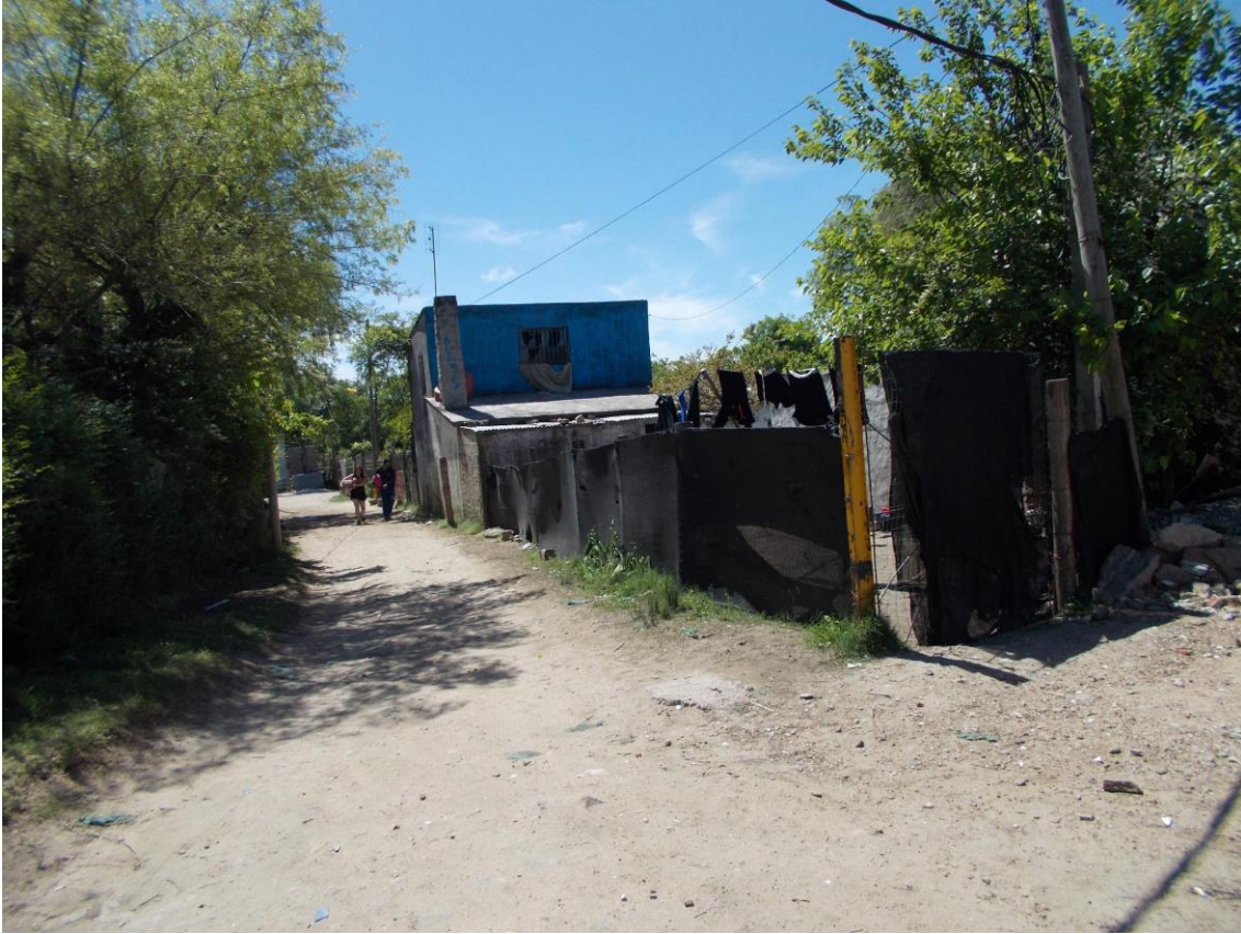
Ronzoni, S., Calle Cheveste y Pasaje 14: viviendas precarias cuyos habitantes no han sido realojados