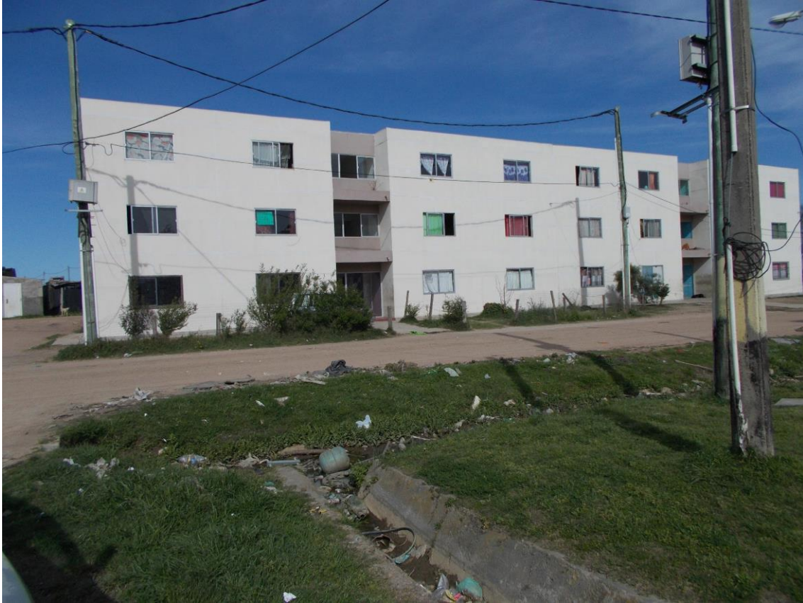
Ronzoni, S., Viviendas en altura tipo edificio a los efectos de maximizar el terreno disponible según la cartera de tierras habitadas