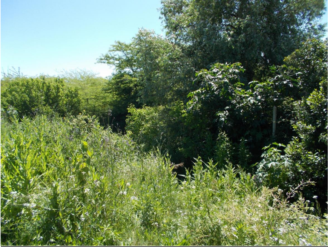
Ronzoni, S., Márgenes Arroyo Carrasco hacia el límite con Montevideo