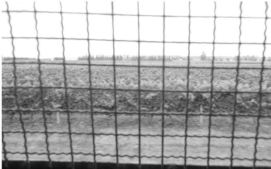
i) Recorrido Central / 25 de Agosto