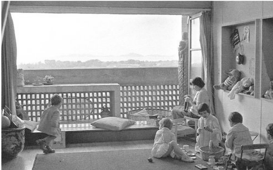
b) La Unité d'Habitation. Marseille, Francia