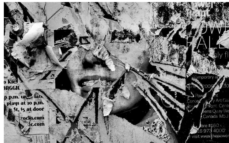
c) Palimpsesto urbano

Por otro lado, el concepto de paisaje como registro también está íntimamente ligado al pasado, debido a que se refiere al paisaje como soporte en el cual quedan las marcas de las acciones realizadas sobre él, las cuales se van superponiendo a lo largo de la historia componiendo un estrato complejo y simbólico. Pero a la vez esta visión del territorio y del paisaje como palimpsesto, cumple otra condición, las marcas a su vez funcionan como recordatorio de la acción que las provocó.