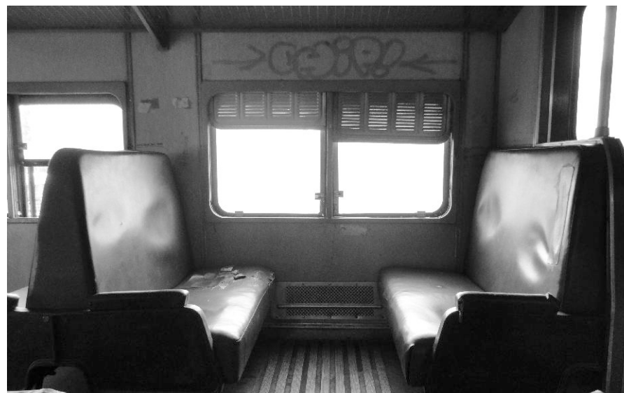
j) Recorrido Central / 25 de Agosto

En el viaje en tren en particular esta experiencia tiene ciertas condicionantes propias del medio de transporte en cuestión. El pasajero se transporta en un vagón, que por su configuración, limita su mirada hacia el exterior permitiendo únicamente las vistas transversales a la línea de tren. La visión del paisaje exterior se efectúa a través de un vidrio y un tejido, en este caso en particular del tren uruguayo.