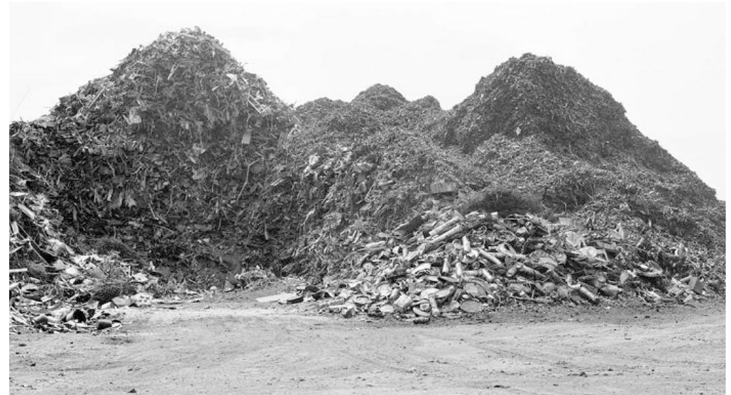
f) Desguace Hermanos López Carretera de Toledo (A-42). Salida km 21. Parla, Madrid

En otra escala y siguiendo la misma temática, la acción inconsciente e