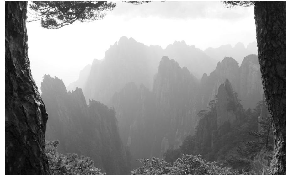
a) Montes Huang - Huangshan, China

El tercer paisaje refiere a los sitios en los cuales el hombre permite que se desarrolle la diversidad biológica, son aquellos lugares que no han sido explotados o han dejado de serlo. Estos sitios tienen diversos orígenes que están diferenciados claramente: los conjuntos primarios, los residuos y las reservas. Los primeros son espacios que jamás han sido explotados, los segundos son el resultado del abandono de porciones de territorio explotadas anteriormente, y por último, las reservas son sitios no explotados por poseer grandes dificultades para hacerlo o por decisión administrativa.