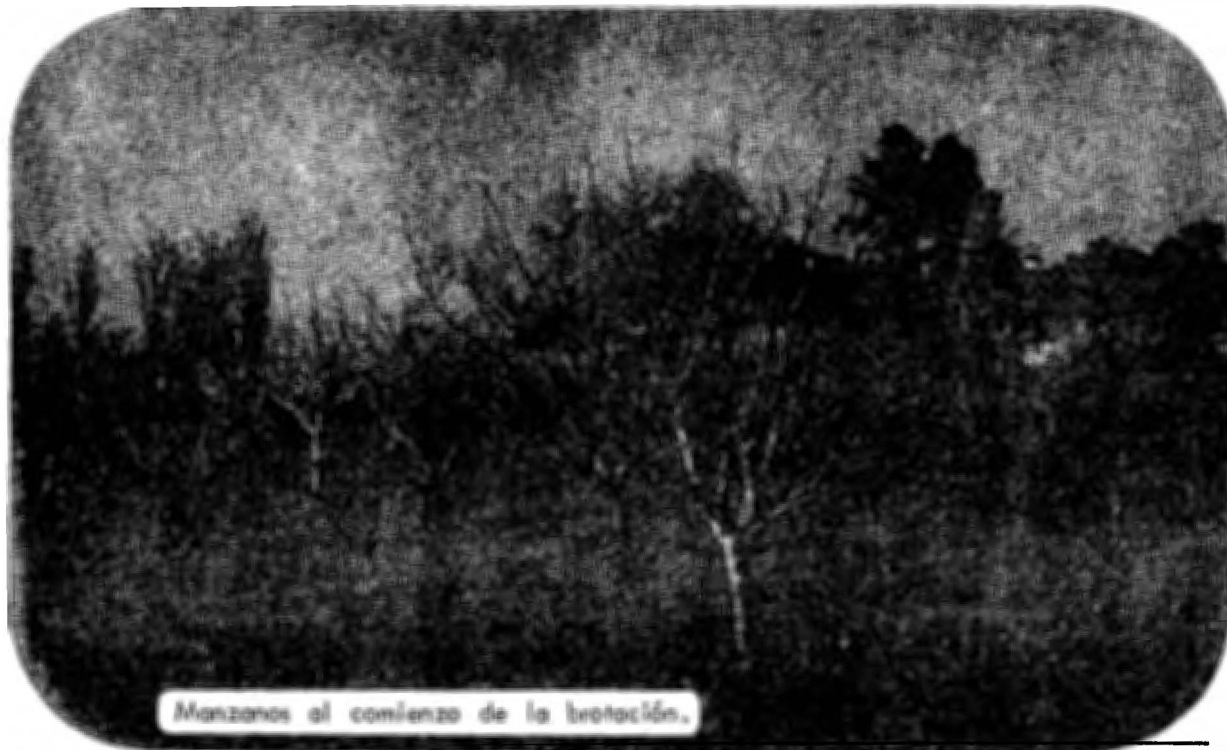
Manzanos al comienzo de la brotación.

Para prevenir las infecciones, tanto primarias como secundarias, que se vuelven tan importantes como las primarias; son numerosos los productos que pueden usarse y los dividiremos en dos grandes grupos.