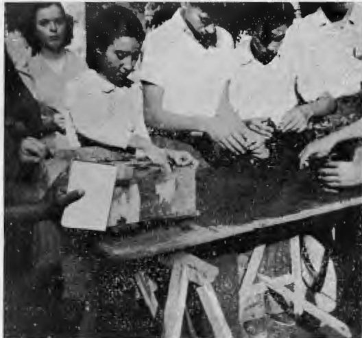
Cumplida la demostración, los alumnos ponen en práctica los conocimientos adquiridos