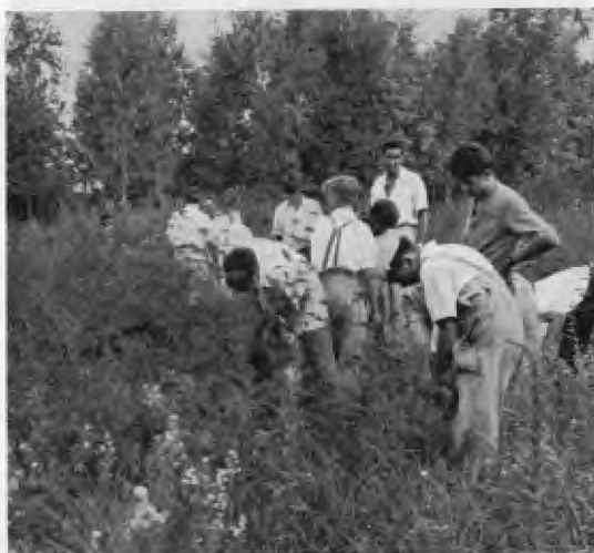
Antes de plantar preparan el terreno