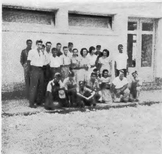
Grupo de alumnos asistentes al Curso