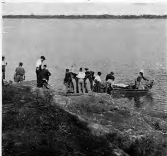
Dispuestos a cruzar el Río Uruguay