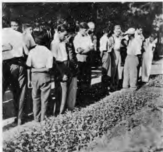
Los trabajos fueron bien realizados y así se han logrado más de 15.000 eucaliptus