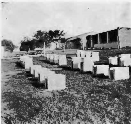
El apiario del Club, donde aprenden haciendo