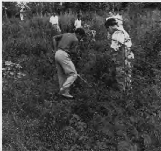
Los muchachos marcan su pasaje por la Isla, instalando un bosque de eucaliptus