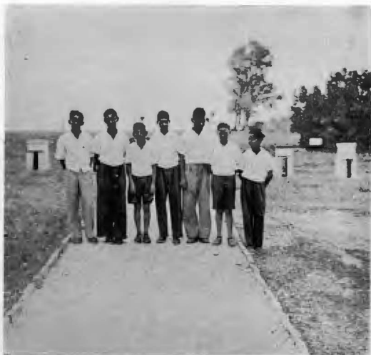
Los socios apicultores se presentan en equipo, para recibir a los visitantes