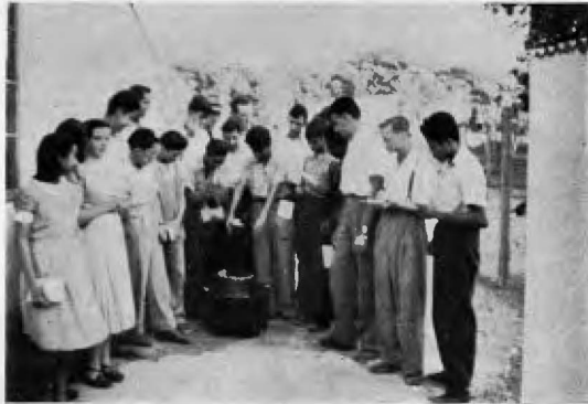
Los alumnos practican el laminado de cera en el apiario de la Escuela