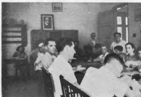
Durante el desarrollo de una sesión