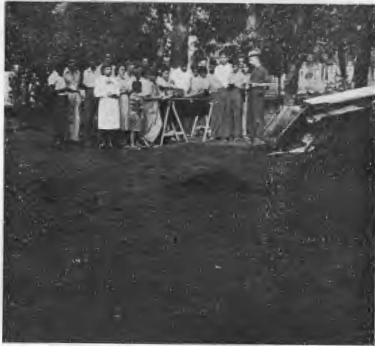
Un aspecto de la demostración sobre el enmacetado de eucaliptus