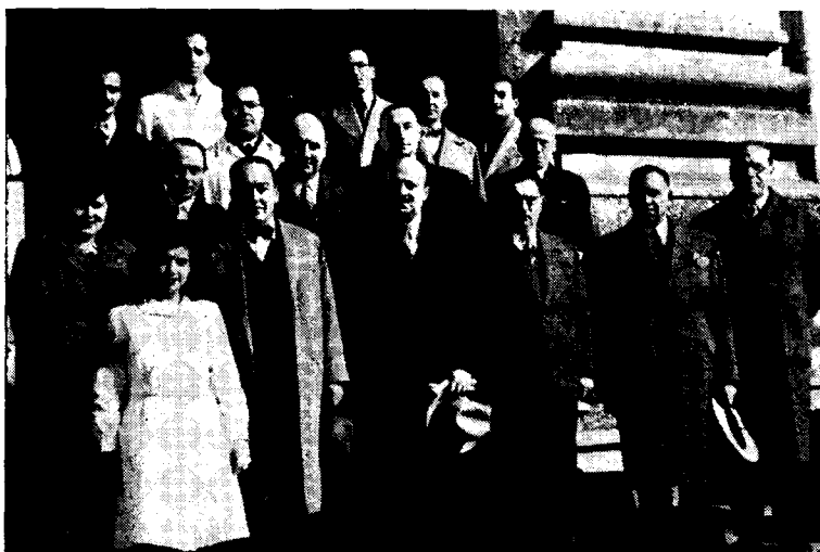
La presente nota representa al ilustre huésped y acompañantes, en la escalinata del Pabellón de Laboratorios y Clases.

En el período mencionado también concurrió a la Facultad una delegación de estudiantes de la Escuela de Agronomía y Veterinaria de