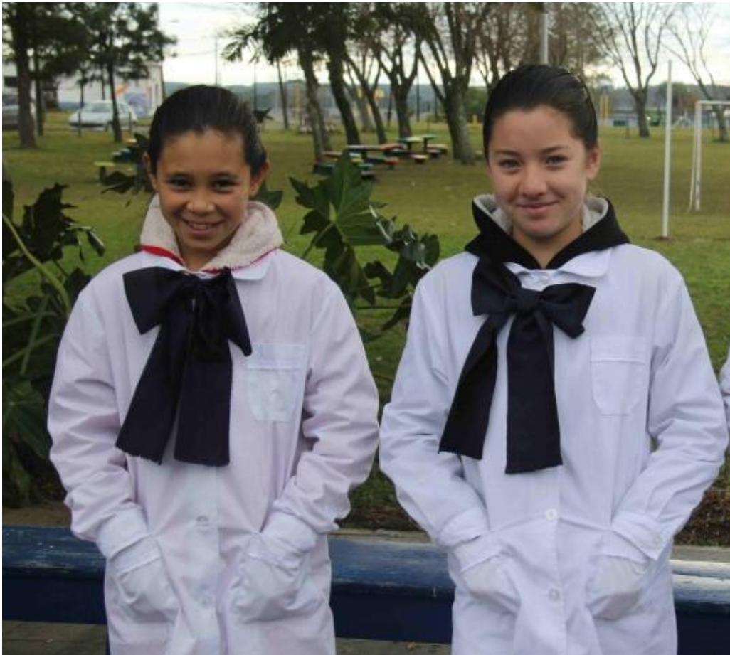
Fotografía: Portal UTE 10/7/2018

que generar un nuevo diseño en el uniforme escolar, pretende una ardua investigación sobre si es necesario el cambio o debe preservarse. Como plantea Martínez, “el cambio debe asociarse a aquello que hay que cambiar, preservando a la vez aquello que hay que conservar. Esto confiere al diseño un carácter distante de la idea de la innovación, y dicho carácter se funda en el discernimiento entre ambas cosas: entre lo que debe mantenerse y lo que hay que transformar, entre lo que es objeto de conservación y lo que es objeto de cambio; entre lo que sale de escena, permanece o entra” (Martínez, 2013, P.3). Actualizando soluciones a problemas que surgen de la interacción del humano con el hábitat.