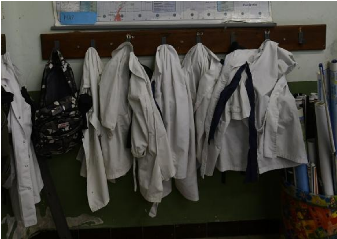
Fotografía: El País, 27/12/2020