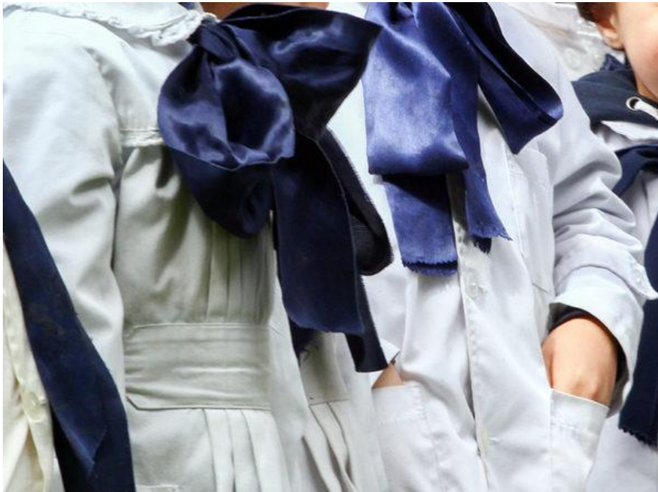
Fotografía: Crédito Focouy, 6/8/2021

Cuando hablamos de deconstruir el cuerpo, en cuanto al género es dejar de lado los estereotipos que entendemos como femenino y masculino.