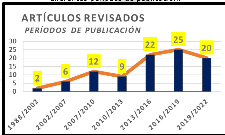
Figura 2: La gráfica muestra el número de trabajos revisados en los diferentes períodos de publicación.

El total de las referencias seleccionadas inicialmente fue de 120. Se descartaron 24 y se analizaron 96, distribuidas según el año de publicación en: 2 (2.1%) con más de 20 años; 6 (6.25%) entre 15 y 20 años; 12 (12.5%) entre 12 y 15 años; 9 (9.4%) entre 9 y 12 años; 22 (22.9%) entre 6 y 9 años; 25 (26%) entre 6 y 3 años y 20 (20.8%) con menos de 3 años. En síntesis, 69.8% (67) de los trabajos revisados tenían menos de 9 años. En la Figura 2 se grafican estos resultados.