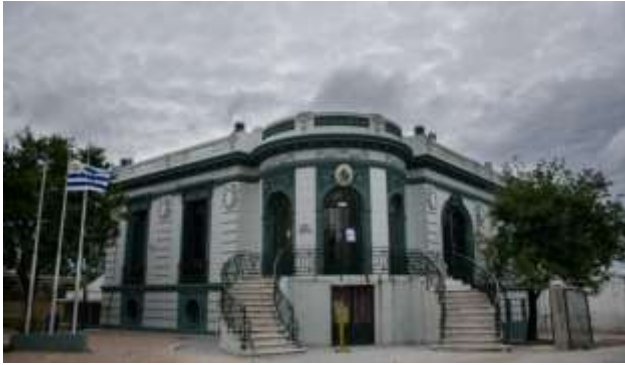
Fotografía ilustrativa. Sofía