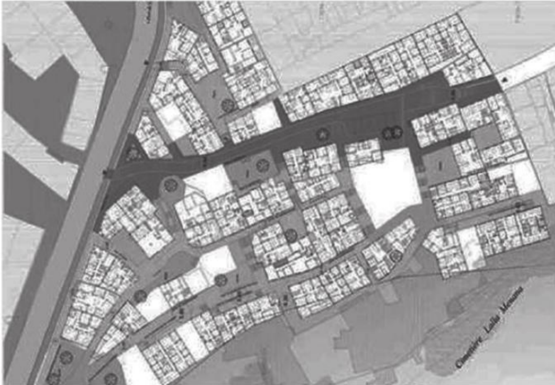
Fig. 6 Plano de reordenación del barrio con las viviendas proyectadas. Obras de construcción de las viviendas y de urbanización por autoconstrucción asistida.