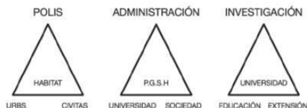
Fig.1 Los triángulos del hábitat, la producción y gestión social del hábitat y la función transformadora de la universidad.

diantes herramientas de comprensión compleja del hábitat, como interacción de realidades físicas, simbólicas, sociales, económicas y políticas (Pelli, V. 2010). Parten de una perspectiva también compleja de su rol como arquitectos en la producción y gestión social del hábitat, en la que habrán de trabajar en equipos interdisciplinarios y en interacción con otros actores sociales y políticos. Y asumen una perspectiva del compromiso social de la Universidad, que se desarrolla a través de la interacción entre sus funciones educativa, investigadora y de extensión universitaria (De Manuel, E. 2010).