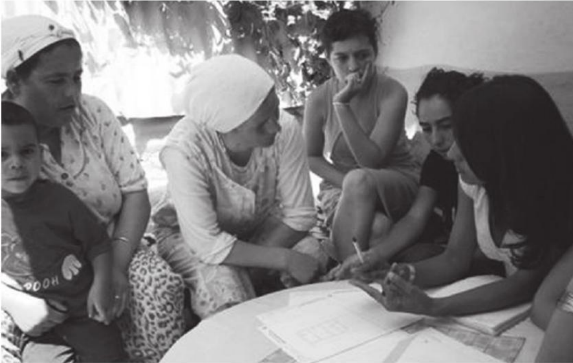
Fig. 7 Diseño participativo de las viviendas del barrio.