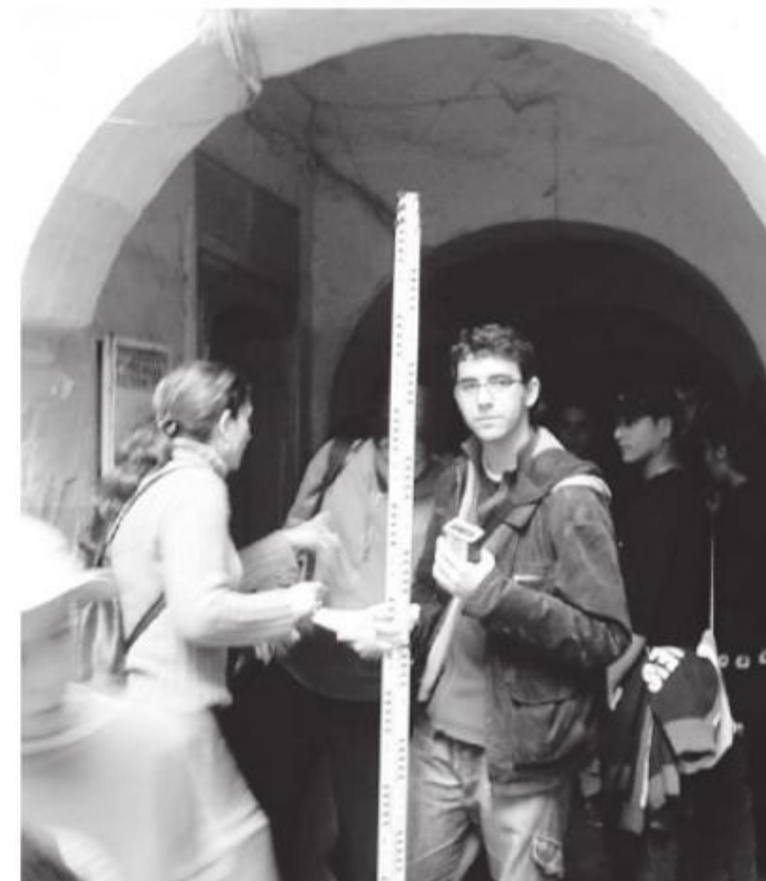
Fig.4 Levantamiento de casas de la Medina de Larache. Febrero de 2006

de función transformadora de la Universidad empezó a mostrar su enorme potencial.