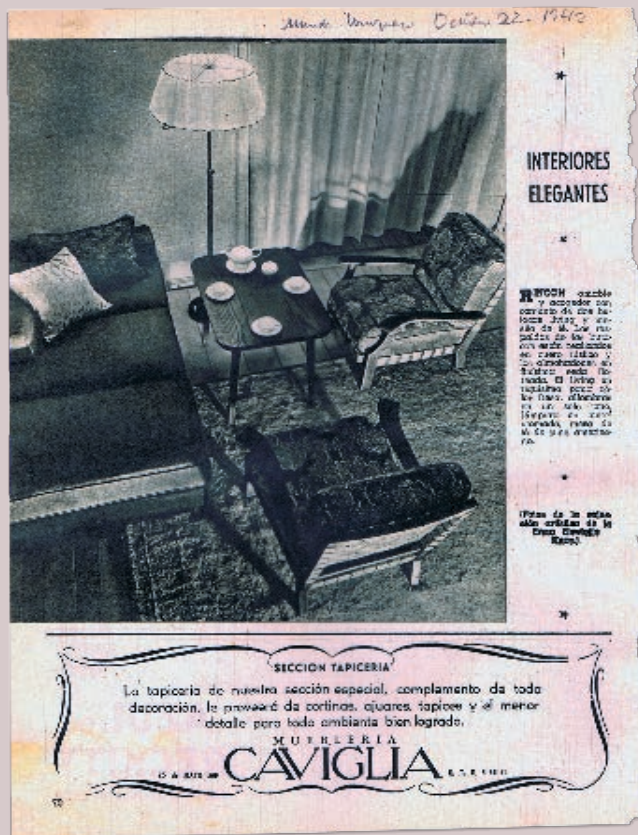
FIGURA 5. PUBLICIDAD DE MUEBLERÍA CAVIGLIA APARECIDA EN MUNDO URUGUAYO EL 22 DE OCTUBRE DE 1942.

El álbum da cuenta de las variables y constantes reguladas por el sistema de identidad de la empresa, de la construcción de diversos enunciados según el medio en el que aparecen, con campañas de largo aliento destinadas a diferenciar su audiencia. Asimismo, ofrece una interpretación de cómo los especialistas y legos configuraron el universo de lo que se reconoce como diseñado y constituye una fuente ineludible para la investigación de la historia del diseño de comunicación visual y los estudios de género en Uruguay. Traza una narración ficcional de un conjunto heterogéneo de consumidores desde un discurso institucional polifónico con las transformaciones necesarias para perdurar.