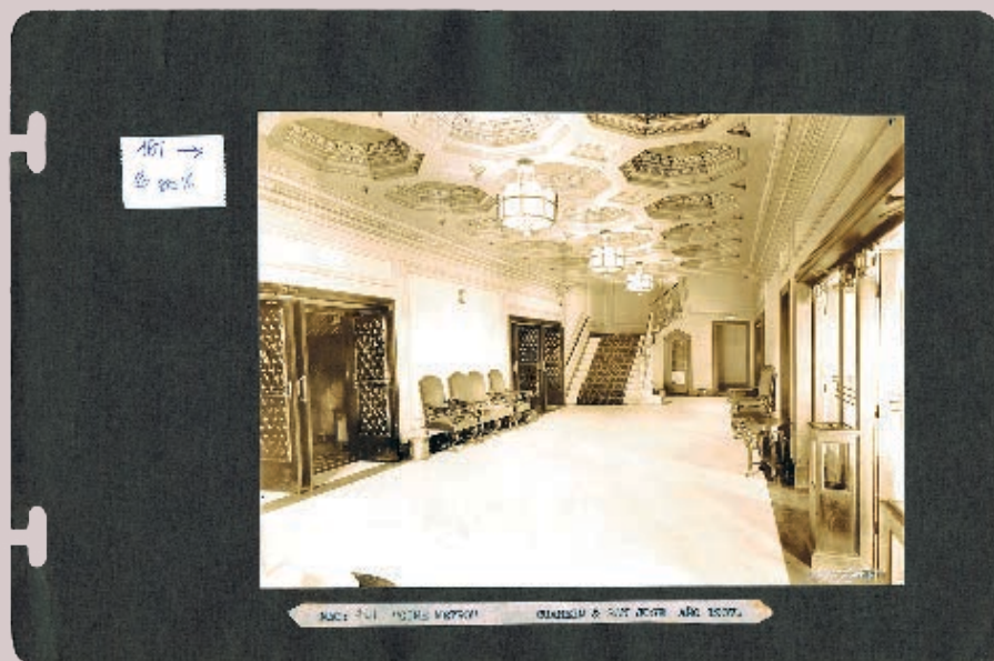
FIGURA 9. INTERIOR DEL CINE METRO, MONTEVIDEO.

de venta, que aludía simbólicamente a escenarios deseados en el imaginario de la época. Esta asociación con un producto cultural contemporáneo de moda, e importado de los centros hegemónicos, destacaba también los atributos de la oferta disponible para la venta en sus locales.