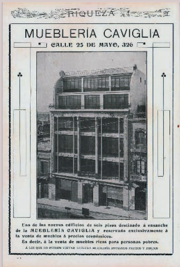
FIGURA 3. PUBLICIDAD DE MUEBLERÍA CAVIGLIA APARECIDA EN RIQUEZA EL 10 DE SETIEMBRE DE 1912.

gias territoriales y un programa de formación no solo de mano de obra, sino también modelador del gusto.