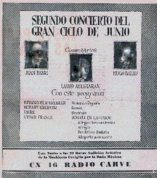
FIGURA 8. PUBLICIDAD DE MUEBLERÍA CAVIGLIA APARECIDA EN LOS DIARIOS EL PLATA Y LA RAZÓN EL 10 DE JUNIO DE 1943.

grafías de distintos sets de filmación de películas, acompañadas de comentarios relativos al equipamiento.