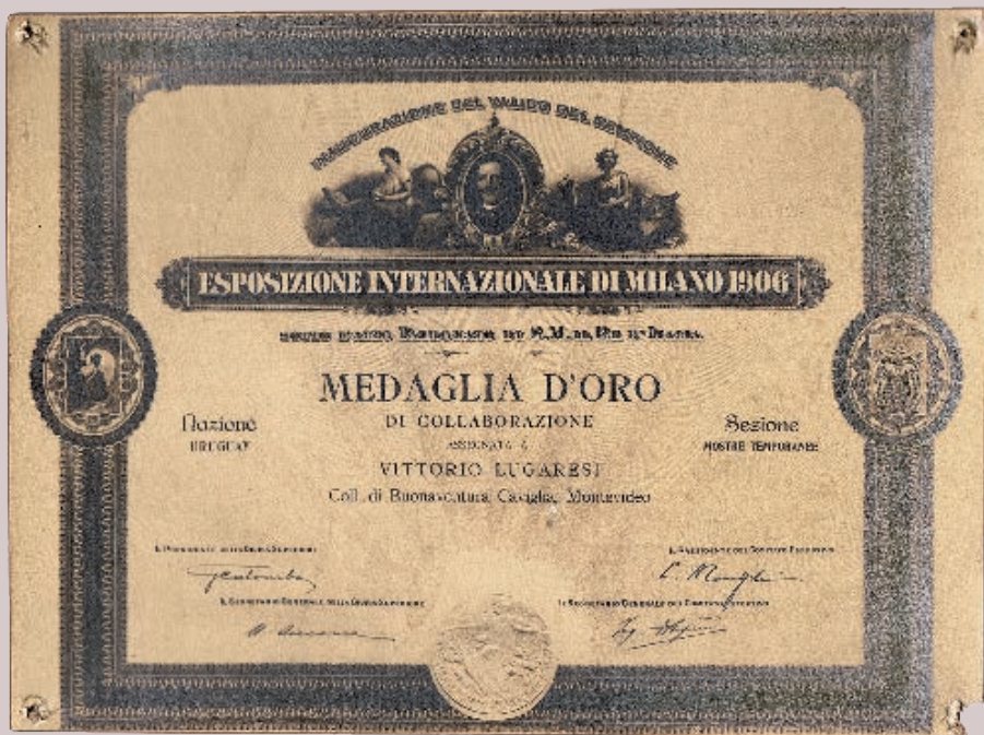
FIGURA 2. DIPLOMA EXPOSICIÓN INTERNACIONAL DE MILÁN. 1906.

Una mirada integral de la donación y su contrastación con otras fuentes permite detectar en la extensa trayectoria tres grandes etapas. La fundacional llega hasta la década de 1930, liderada por las dos primeras generaciones. A partir de la producción y venta de muebles, amplió el modelo de negocios al de tienda por departamentos que se imponía en Europa, 6 pero dedicada solamente a artículos del hogar nacionales e importados. Un segundo momento, entre mediados de la década del treinta y fines de los sesenta, muestra un claro protagonismo de Tito Caviglia, que jerarquizó lo proyectual articulado con la producción, la comercialización y diversas actividades culturales. Finalmente, las últimas décadas del siglo XX estuvieron caracterizadas por nuevas formas de diseño, producción y comercialización.