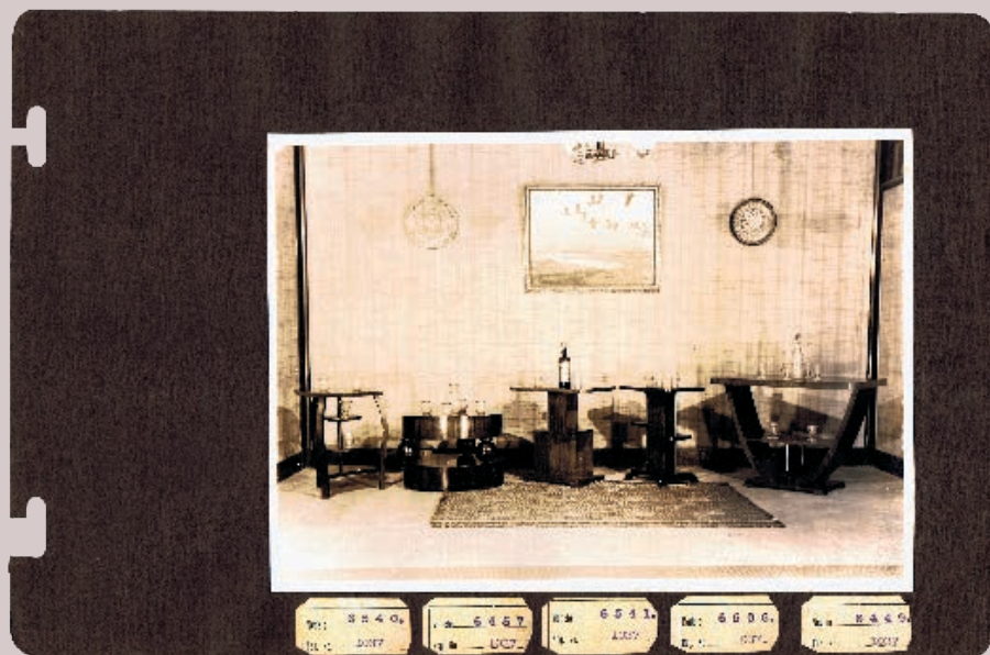
FIGURA 10. MUEBLERÍA CAVIGLIA, SALÓN DE EXPOSICIÓN DE MUEBLES.

El conjunto de estas acciones de carácter cultural contribuyó sin duda a la venta de los productos. Se movieron entre el mundo de los negocios, el de la cultura y el de la política, asociándose y configurando redes, en un circuito que generó beneficios económicos y culturales.