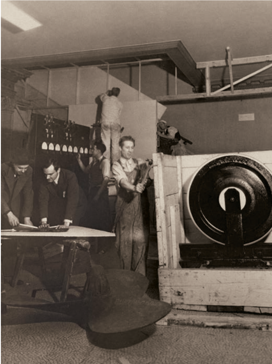
FIGURA 2. PHILIP JOHNSON, DIRECTOR DEL DEPARTAMENTO DE ARQUITECTURA, PREPARANDO LA EXPOSICIÓN MACHINE ART , EN 1935.