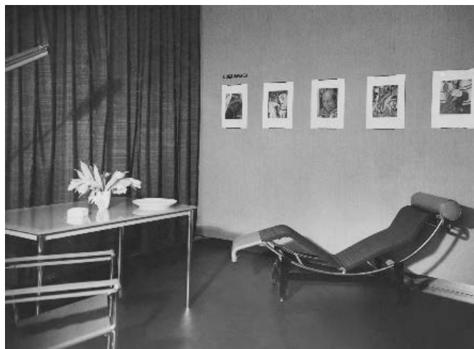
FIGURA 5. EL ARCHITECTURE ROOM DISEÑADO POR PHILIP JOHNSON EN 1933 PARA MOSTRAR LAS REPRODUCCIONES DE LA OBRA MURAL DE DIEGO RIVERA.

lidades técnicas (desarrolladas en Alemania) de la reproducción a color. La intención comercial era patente: se proporcionaba al público reproducciones de alta calidad para ser enmarcadas y colgadas en las paredes de casas particulares como si fuesen originales. La obra de Rivera pasaría al interior doméstico moderno de la burguesía progresista estadounidense. Como para que no hubiese dudas del proyecto tanto comercial como estético, Alfred Barr pidió a Philip Johnson que diseñase este interior moderno, que fue conocido como el Architecture Room (1933) (F. 5). Aquí se presentó la primera fusión de la modernidad pictórica desarrollada en Latinoamérica y la arquitectura funcionalista del International Style , expandiendo los límites espaciales en los que se había desarrollado la Escuela Mexicana. De la monumentalidad heroica de los edificios públicos se pasó al interior doméstico, lo que daba lugar a la creación de un nuevo mercado artístico. El muralismo mexicano sería así consumido en alianza con el International Style .