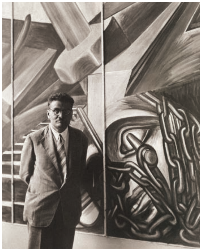
FIGURA 6. JOSÉ CLEMENTE OROZCO FRENTE AL MURAL DIVE BOMBER AND TANK , PINTADO POR ÉL EN 1940, EN EL MOMA, DURANTE LA EXPOSICIÓN TWENTY CENTURIES OF MEXICAN ART .

que ese país despertó en Estados Unidos después de la revolución de 1910, el caos subsiguiente, la abierta amistad con la recién formada Unión Soviética y la nacionalización del suelo y los recursos naturales bajo la Constitución de 1917 generaban amplias necesidades de establecer relaciones cordiales a todos los niveles. Así, en 1939, ante la oportunidad de la Feria Mundial de Nueva York, y teniendo en cuenta los gestos reconciliatorios del presidente Lázaro Cárdenas, el MoMA se embarcó en una de las exposiciones más grandes y complejas de su historia: Twenty Centuries of Mexican Art (1940). 11 Con esta compleja exposición, en la que participaron todos los departamentos y que ocupó todo el edificio, se perfila cómo