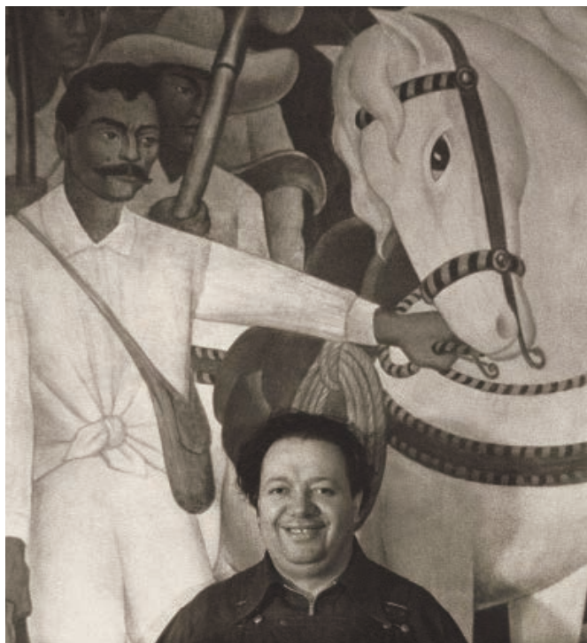
FIGURA 3. DIEGO RIVERA ANTE EL MURAL AGRARIAN LEADER ZAPATA , REALIZADO EN EL MOMA EN 1931.

posible cultura moderna estadounidense madura e independiente. No sorprende, pues, que la exposición con la que abre sus puertas, Cézanne, Gauguin, Seurat, Van Gogh (1929), sea de corte decididamente europeizante. Este retorno al posimpresionismo advierte ya una posición conservadora, un cierto rappel à l'ordre después del desorden y la conmoción creados por el Armory Show , que con obras como Nude Descending a Staircase (Nº 2), de Marcel Duchamp, y Dance at the Spring , de Francis Picabia, ejemplificaban no sólo los impulsos descontrolados de la vanguardia, sino la degeneración del arte europeo desfigurado por la abstracción y contaminado por el primitivismo. 7 Desde su inicio, este experimento que era el MoMA mantendría una clara tensión entre la innovación y la tradición, en beneficio de la ecuanimidad temática, la elegancia compositiva y el equilibrio formal. 8