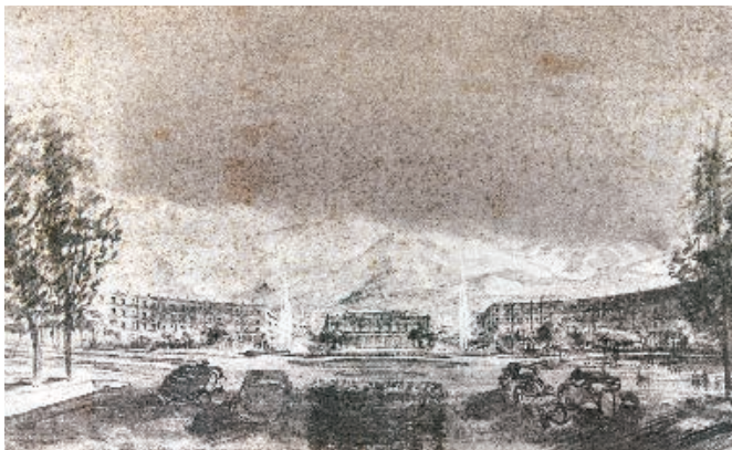
FIGURA 5. CARTÓN DEL PLAN REGULADOR DE MENDOZA.