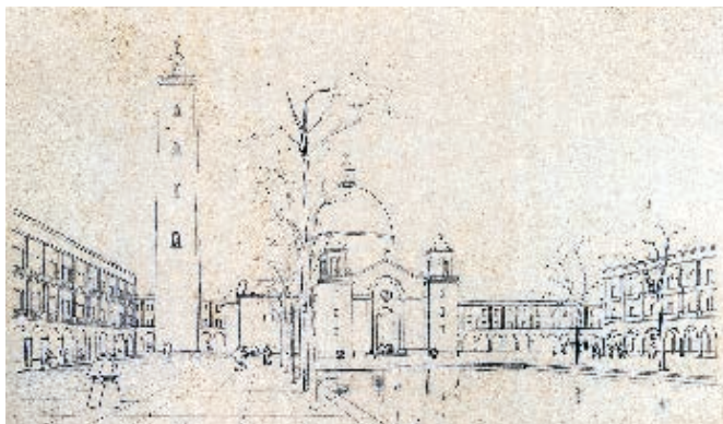
FIGURA 4. CARTÓN DEL PLAN REGULADOR DE MENDOZA.