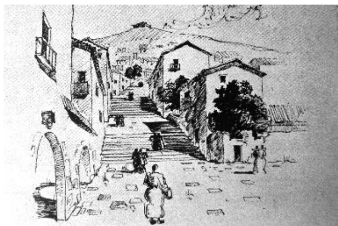
FIGURAS 2 y 3. «EL CERRO. CURSO DE URBANISMO».

Las visuales interrumpidas, las calles ondulantes, la relación entre los edificios, el borde cerrado de las plazas con centros vacíos eran tópicos que se alineaban indudablemente con la tradición del Arte Urbano difundido por Camillo Sitte.