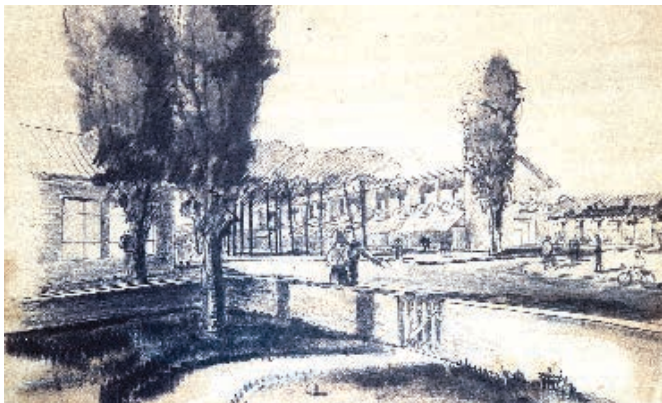
FIGURA 6. CARTÓN DEL PLAN REGULADOR DE MENDOZA.