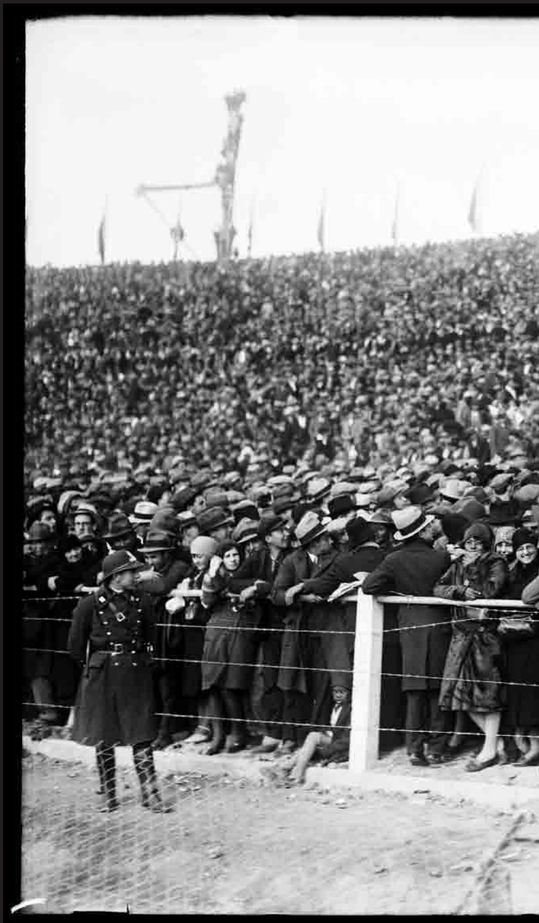
Público en el talud de la tribuna Ámster- dam durante el partido entre Uruguay y Perú por la Copa Mundial de Fútbol, el día de la inauguración del Estadio Centenario. 18 de julio de 1930. (FOTO: 0086FMHD.CDF. IMO.UY - AUTOR: S.D./IMO).