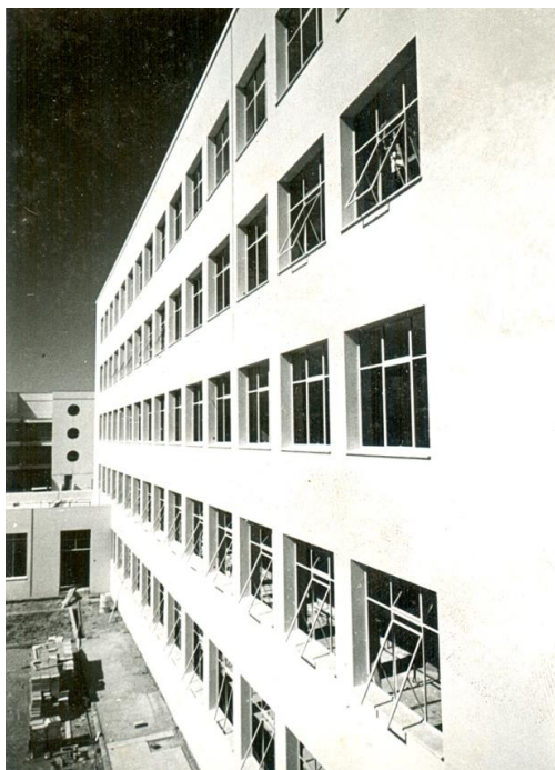
Fig. 1. Facultad de Odontología en construcción.