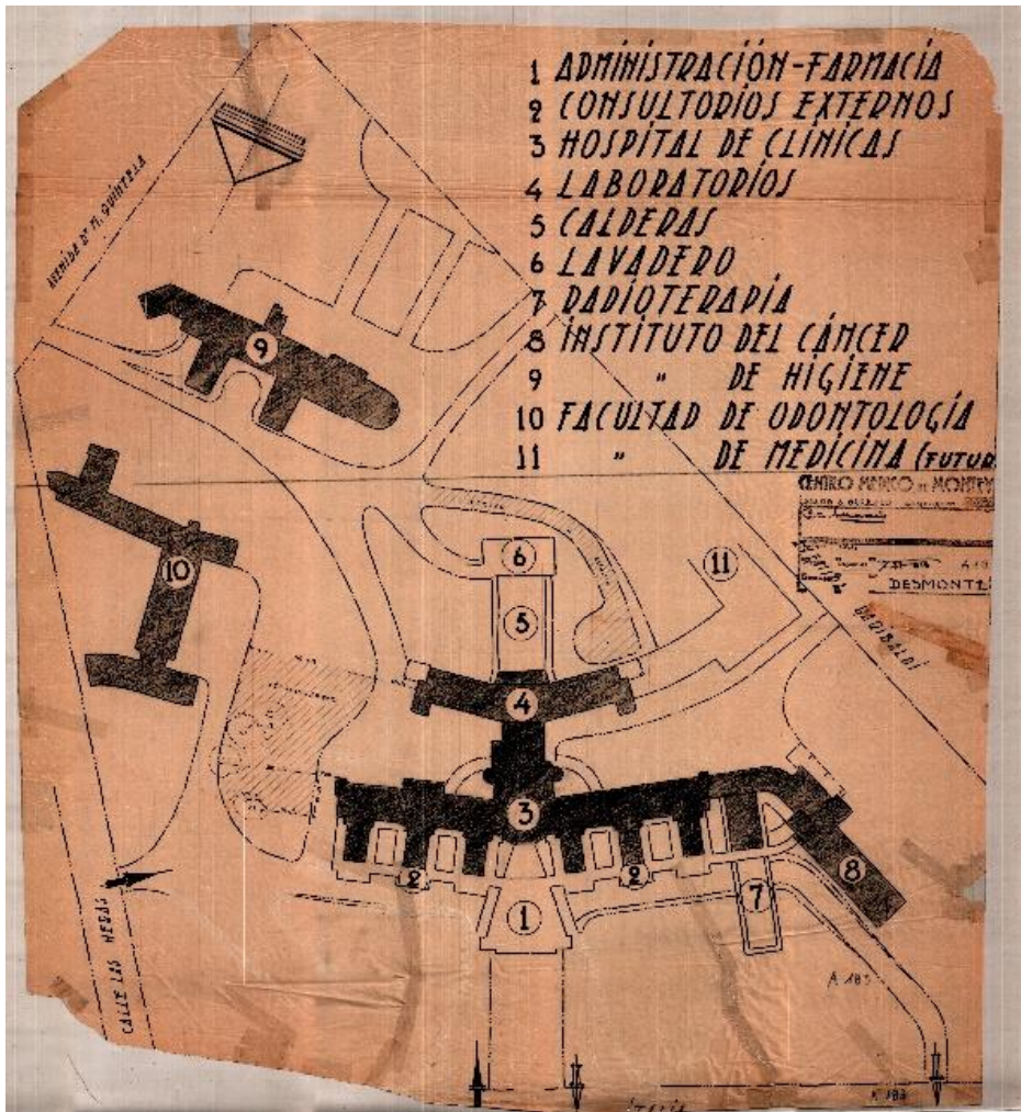
Fig. 4. Plano del Centro Médico de Montevideo realizado por Surraco o alguno de sus dibujantes. La ausencia del Instituto de Traumatología y la definición del proyecto para Odontología sitúan este gráfico alrededor de 1935.

Las preexistencias no parecen haber intervenido en la decisión de organizar la obra mediante tres volúmenes articulados entre sí o la de generar un eje principal en el sentido norte-sur. La orientación del edificio lleva a pensar más bien en una decisión deliberada de ubicar el acceso principal al norte y las principales estancias para enseñanza e investigación al este y al oeste. De este modo, la fachada que recibe al visitante estaba siempre iluminada, mientras los salones de clase evitaban la orientación más desfavorable. De modo similar al antecedente de 1929, la ar-