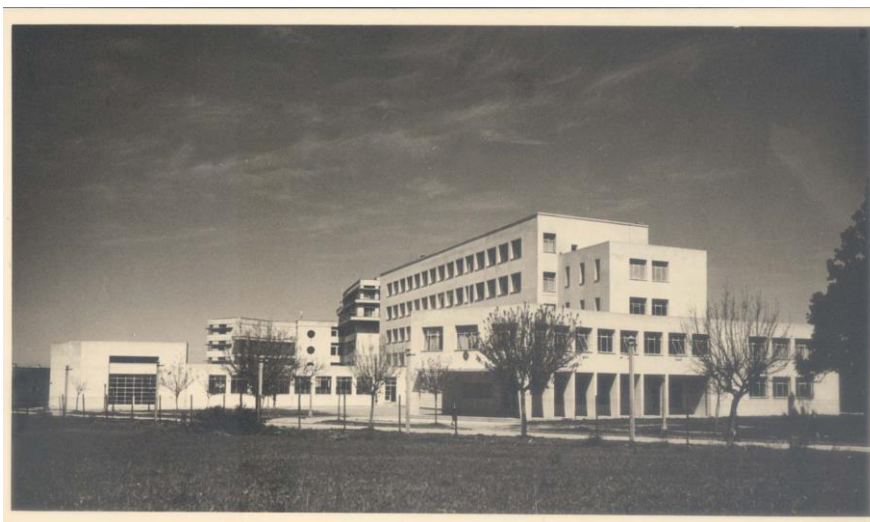
Fig. 5. Fotografía de la Facultad en la época de su inauguración (1940).

estructura de hormigón armado, si bien utilizaba un módulo de tres metros, se adaptaba a las situaciones cambiantes que planteaba el edificio (figura 5).