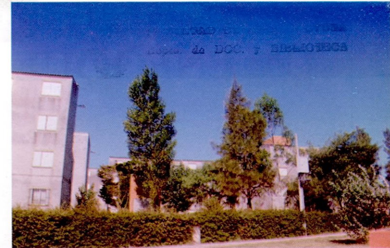
EL VAGETAL COMO ESTRUCTURADOR

En los EEVIS el Verde va a afirmar la estructura del tejido circundante. El Conjunto, de esta manera, en vez de presentarse como objeto disociado, pasa a ser un MODELO ESTRUCTURADOR.