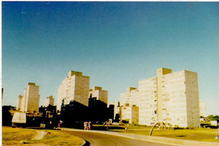
IMPACTO VISUAL TOTAL A CORTA Y GRAN DISTANCIA