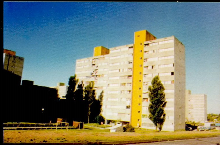
UNA MASA VERDE ATENUARIA EL IMPACTO VISUAL A CORTA DISTANCIA