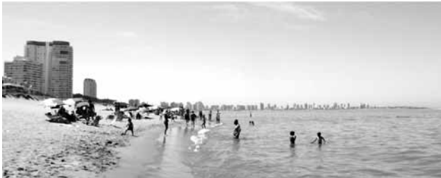
Turismo de sol y playa en la bahía de Maldonado. Sun-and-beach tourism in Maldonado bay.