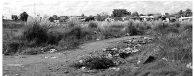
Área de prioridad social en la periferia de Maldonado. Social priority area in the outskirts of Maldonado.