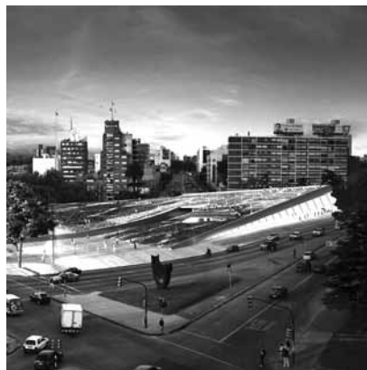
Concurso de Ideas para la Plaza de la Democracia Contest of Ideas for Plaza de la Democracia