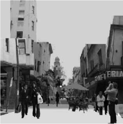
Proyecto de la Peatonal Sarandí Project of Sarandí Pedestrian Street