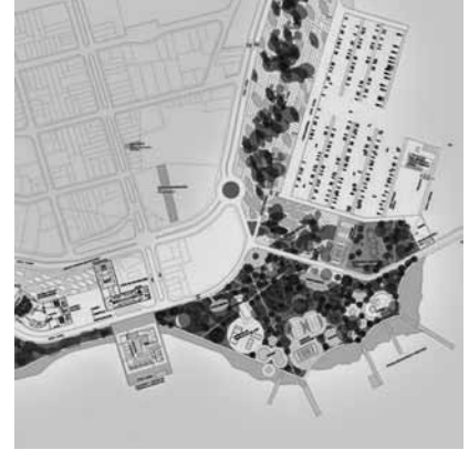
Expresiones de Interés para la Costa y el Hotel Carrasco Expressions of Interest for the waterfront and the Carrasco Hotel