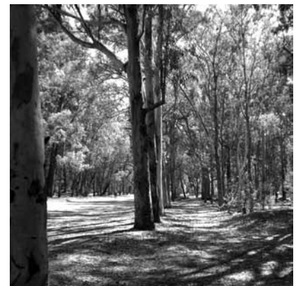
Llamados a expresiones de interés para el Parque Roosevelt Calls for Expressions of Interest for Roosevelt Park