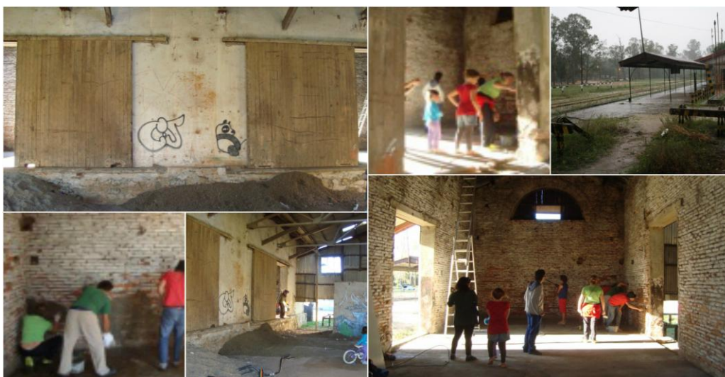
Fotos de las jornadas de trabajo de reacondicionamiento y recuperación de los galpones de AFE.

El proyecto finalmente fue aprobado por AFE el 13 de agosto de 2009. Mediante un acuerdo en el que participa la Intendencia de Canelones, se le entrega el espacio el 6 de octubre de 2010, y enseguida comienza el proceso de obras de reacondicionamiento y recuperación de ese edificio histórico que fue realizado en mingas 41 , como el colectivo refiere, donde participan muchos-as integrantes de la comunidad y amigos-as.