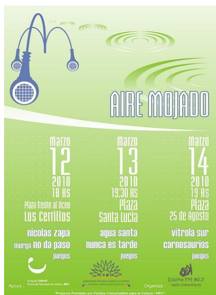
Afiche de actividades del Proyecto

desarrollando el trabajo colectivo y capacidades para desenvolverse en los medios de comunicación. (Colectivo Espika, 2009a, p.2)