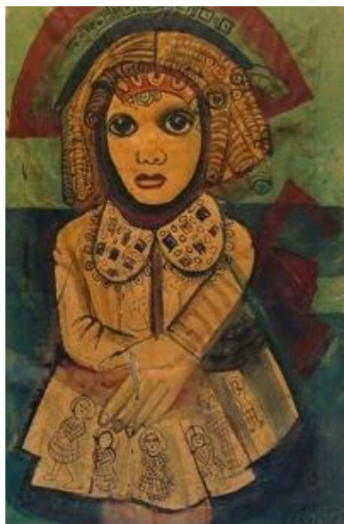
Acuarela de Cabrerita

Así, la ciudad de Santa Lucía, al decir de su gente y a partir de políticas de externación que podemos ubicar en el año 1985 con la creación del Plan Nacional de Salud Mental, convive con la locura y los locos que andan por todo el pueblo.