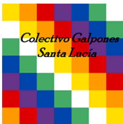
Logo del colectivo Galpones

espacio, que decide denominarse “Colectivo Galpones”, al inicio este colectivo estaba compuesto por: Grupo de Teatro Nosotras, la ONG “Todos por los Niños”, la murga “Casi Murga No Da Paso”, la banda “Carnosaurios” y el Colectivo Espika.