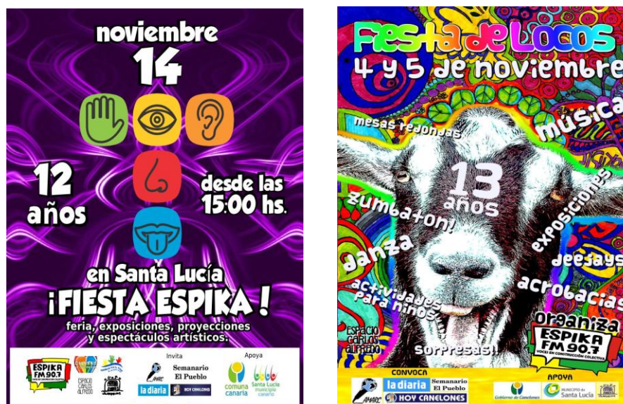
Afiches de difusión realizados por el Colectivo Espika

Las fiestas de aniversario de Espika FM tienen la particularidad de integrar y desarrollar diferentes ejes temáticos, siendo esta una forma de nutrir su agenda en derechos humanos, pilar fundamental de su proyecto político-comunicacional y de estrategias de incidencia. Es así, que dentro del festejo de cada año proponen un eje temático, llevan adelante mesas de debates, transmisiones en vivo instalando un dispositivo de radio parlante, feria de exposición de experiencias de diversas organizaciones sociales locales y nacionales, artesanos y productores familiares de la zona, espectáculos artísticos y musicales, entre otras cosas.