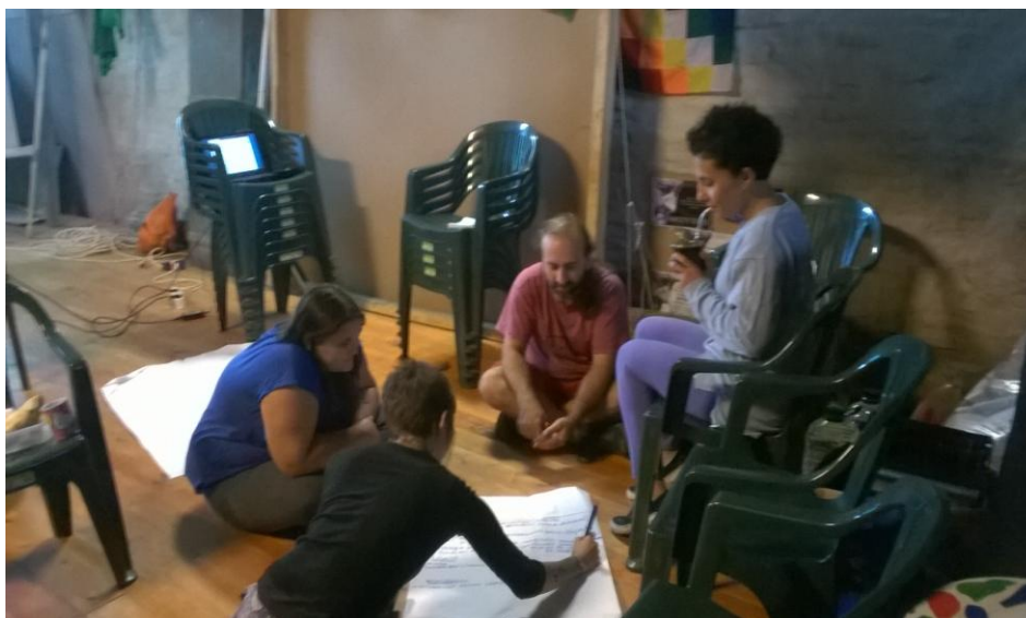
Fotografía de un subgrupo del taller

La realización de este taller surgió de las instancias de asambleas del colectivo en un contexto particular, dado que hacía un mes que no estaban saliendo al aire ya que se había