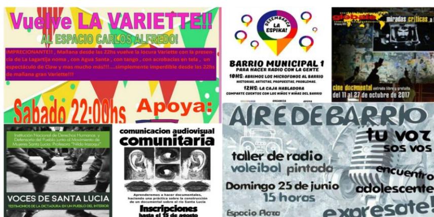
Afiches de actividades

Las actividades propuestas desde la inauguración del Espacio Carlos Alfredo, como abrevian sus integrantes, hasta el día de hoy conservan las características y los objetivos delineados desde el inicio del Colectivo Espika, profundizando el trabajo en red e integrando más organizaciones, vecinos y vecinas; apoyando diversas luchas y promoviendo la sinergia del movimiento social.