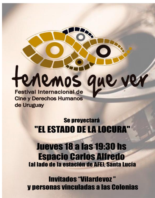
Afiche de difusión realizado por el colectivo Espika

Este festival es organizado por el colectivo Tenemos que ver y la ONG Cotidiano Mujer, el objetivo del mismo es “poner en pantalla un cine de calidad que reflexione sobre la defensa, reivindicación y vulneración de los Derechos Humanos en la actualidad” ( http://www.tenemosquever.org.uy ).