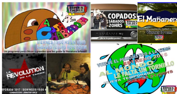
Afiches de programas

Asimismo, promueven a través de los mismos la cobertura de aquellas temáticas que están en la agenda pública realizando un tratamiento de las mismas con información alternativa, contrapo-niendo otra forma de producir noticias a la de los medios de comunicación