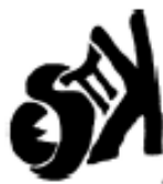
Primer logo de la radio

Por otro lado, en sus orígenes el nombre de la radio se escribía de forma diferente de la que se escribe actualmente, se escribía: Es más \pi (el símbolo de Pi) más la K rusa.