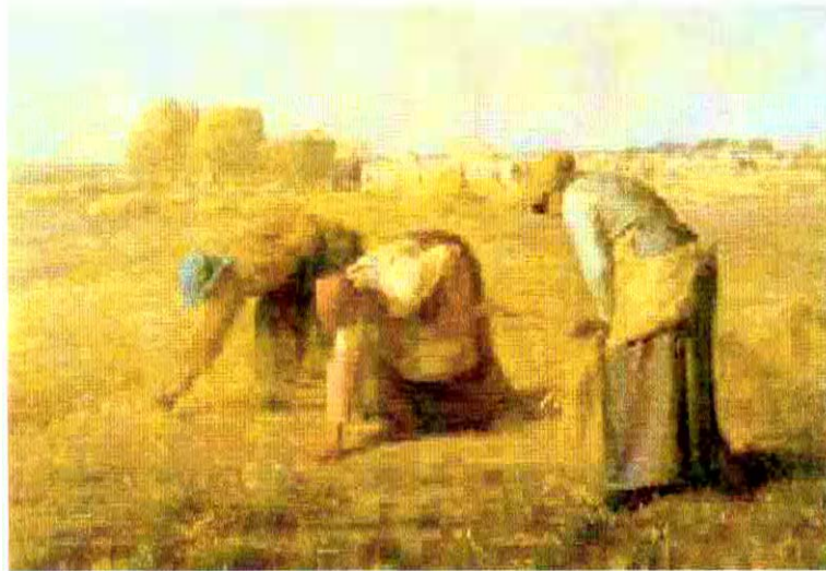
Jean-François Millet (1814-1875) 6 Espigadoras, 1857