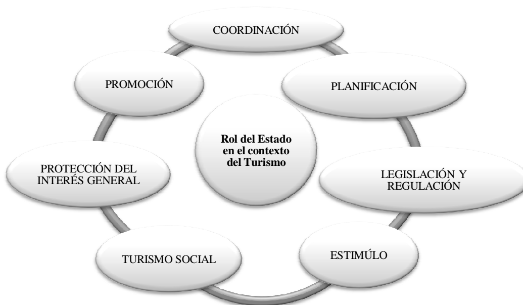
Fig. 3. Los ámbitos de actuación del gobierno en el contexto del turismo (Hall:1994)

La evolución de funciones y objetivos se realiza en proceso de yuxtaposición. Con el avance hacia un nuevo estadio, se asume lo desarrollado en el anterior. Igual ocurre con los argumentos políticos que apoyan las diferentes acciones gubernamentales que se desarrollan.