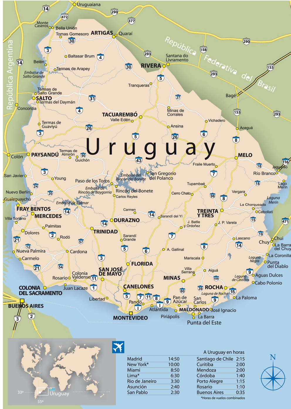
A- Mapa de Uruguay.