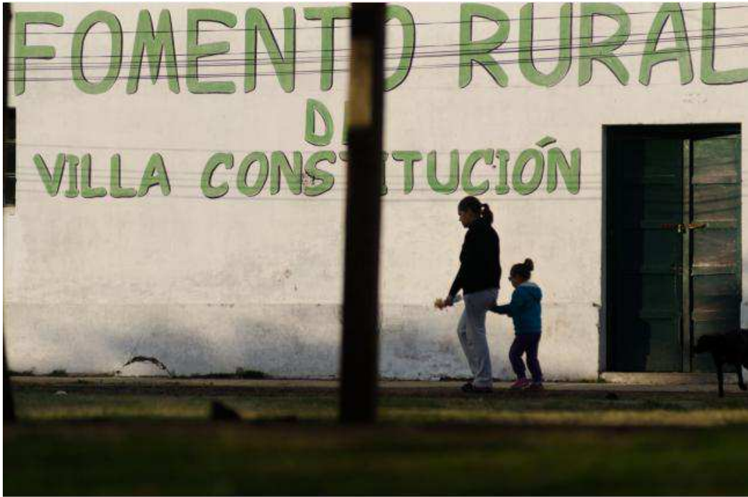
Imagen de Villa Constitución