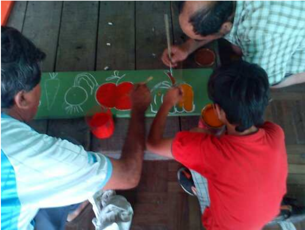
Vecinos de Belén realizando cartelería indicativa para el pueblo en el marco de la Bienal de Salto de 2013 y el trabajo del GLT.