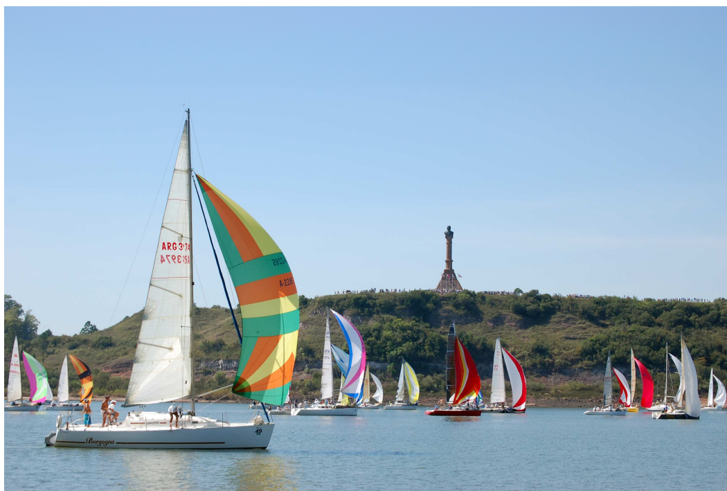
Regata de Meseta de Artigas.