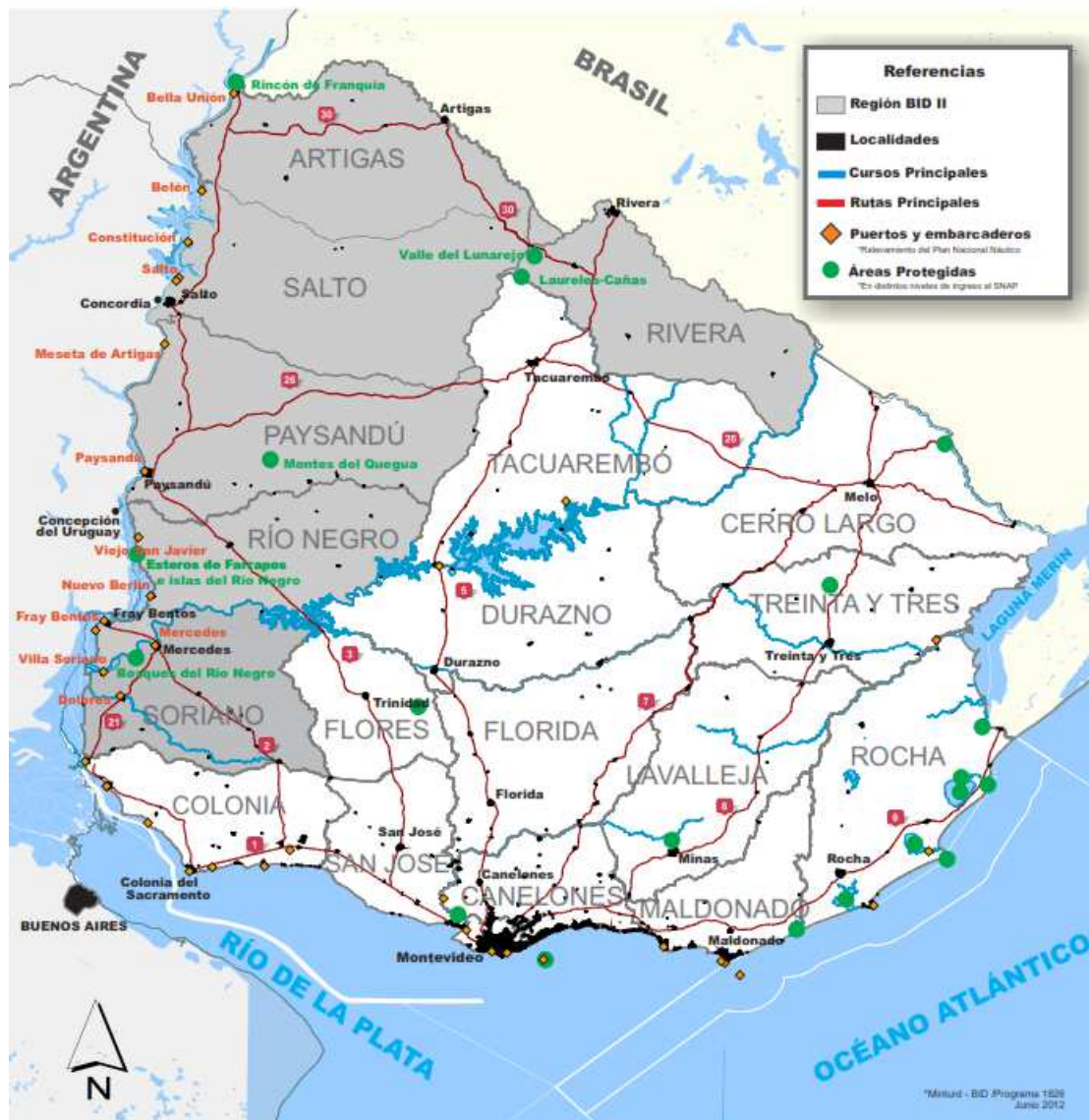
Área de Intervención del PAST.