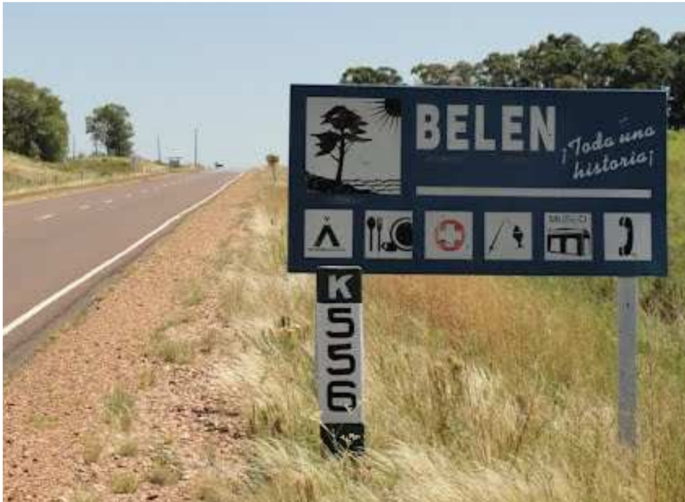
Cartel de acceso a Belén en ruta 3.

El bajo nivel educativo, las dificultades de trabajo asociativo, y la falta de capital propio, propician la idea de un impulso exógeno, mientras que experiencias comunitarias incipientes pero concretas, aportan la visión endógena del desarrollo.