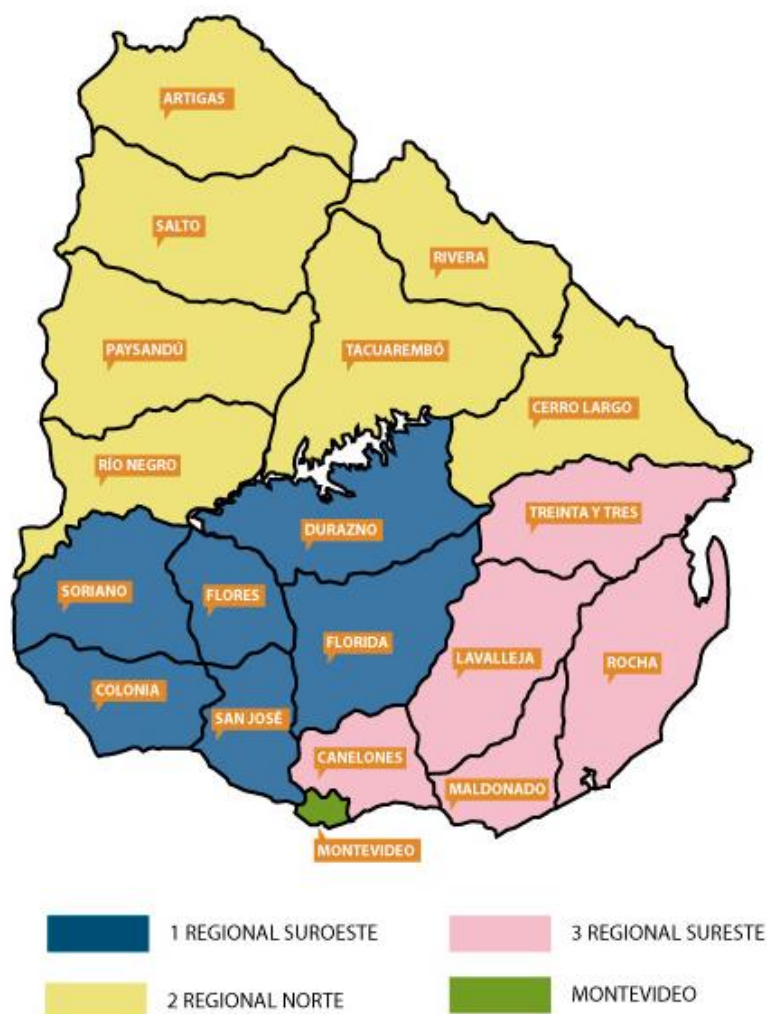
Ilustración 3: