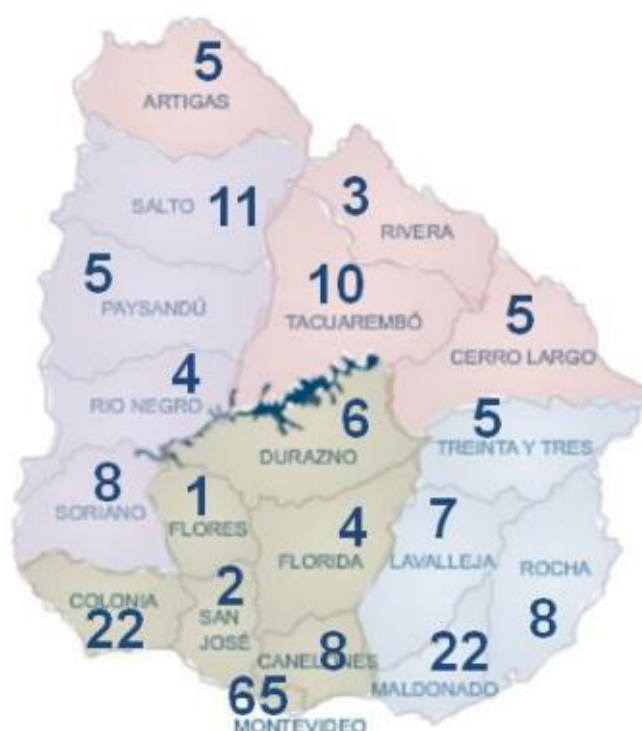
Ilustración 1.

Dada la profundidad de la investigación, este Censo permitió el hallazgo de líneas de trabajo concretas sobre las que trabajar: