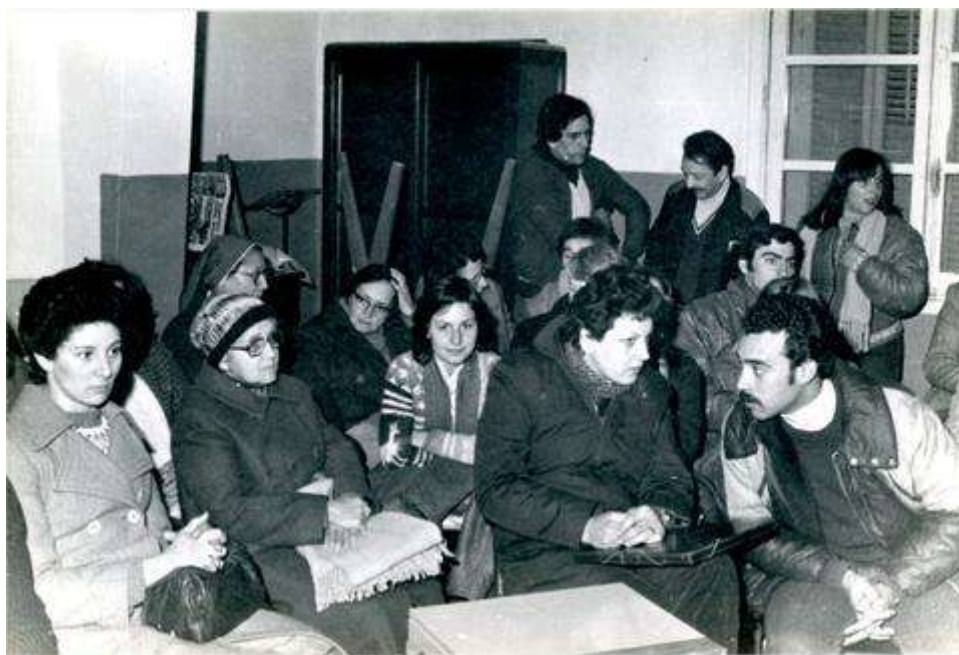
Fotografía 3. Reuniones sobre el ayuno del SERPAJ. Agosto de 1983.