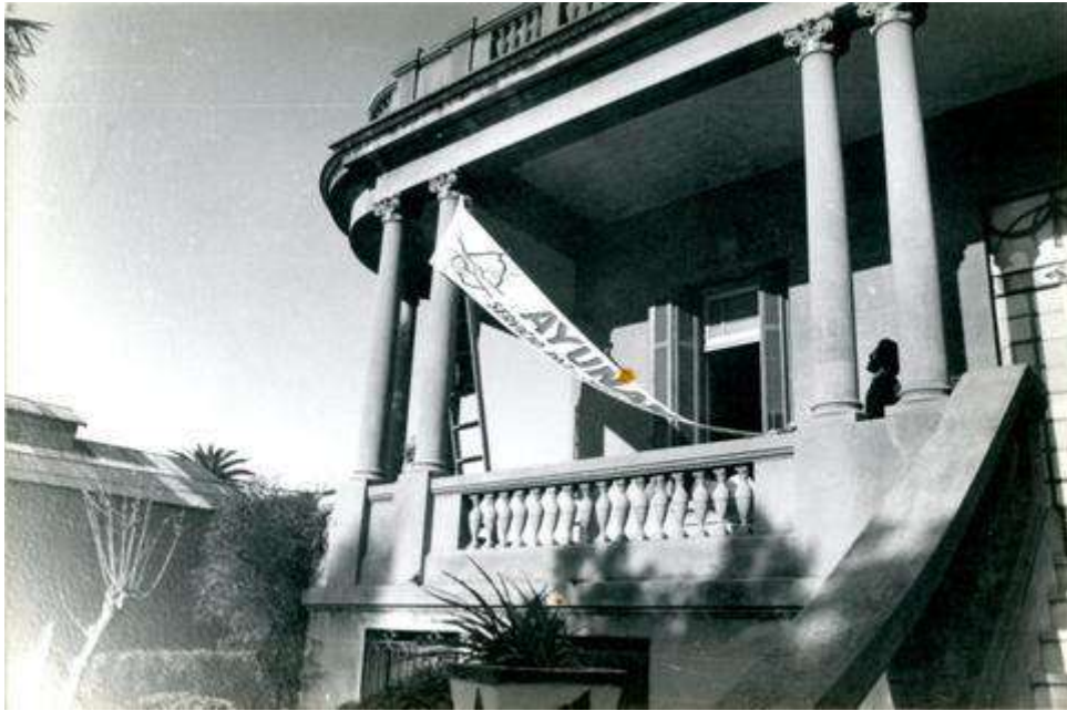
Fotografía 1. Frente de la antigua sede del SERPAJ en Gral. Flores. Agosto de 1983.