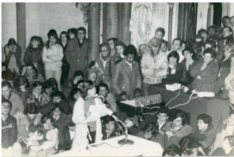
Fotografía 4. Celebración por el ayuno en Iglesia Sagrada Familia (Capilla Jackson). Agosto de 1983.