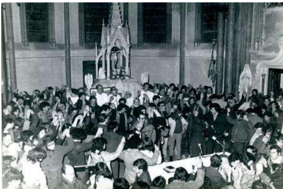
Fotografía 6. Celebración por el ayuno en Iglesia Sagrada Familia (Capilla Jackson). Agosto de 1983.