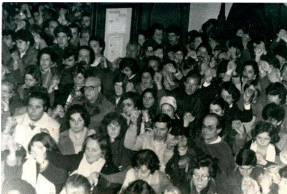
Fotografía 5. Celebración por el ayuno en Iglesia Sagrada Familia (Capilla Jackson). Agosto de 1983.